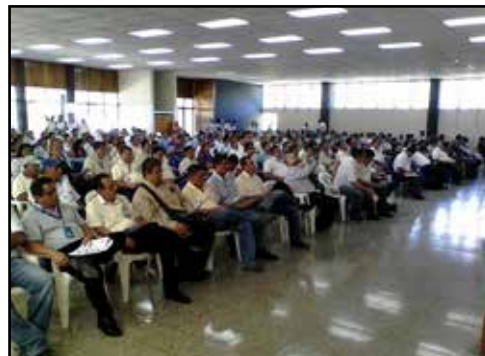
EL SALVADOR.- Se reafirma la continuidad en la lucha en el MINED