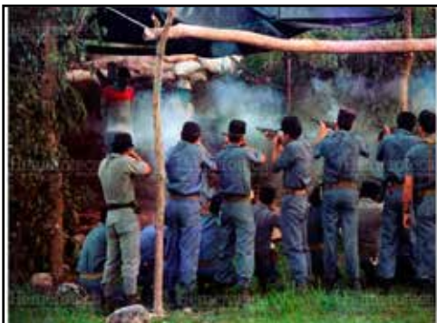
GUATEMALA.- No a la pena de muerte, No a la Ley Anti Maras

VENEZUELA.- EL GRAN NEGOCIO DE LA DEUDA Y VENTA DE BONOS, ALIMENTADOS POR LA CRISIS