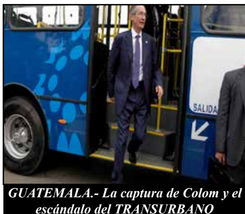
GUATEMALA.- La captura de Colom y el escándalo del TRANSURBANO

NICARAGUA.- RECORTES AL SUBSIDIO DE LA ENERGÍA.