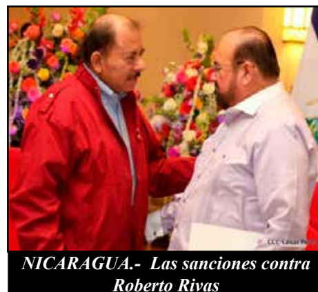
NICARAGUA.- Las sanciones contra Roberto Rivas