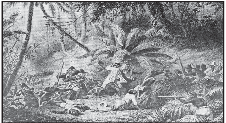
Haití fue el segundo país en América en proclamar la Independencia

El 14 de agosto de 1791 comienza la gran sublevación de esclavos en el norte, donde se concentraban la mitad