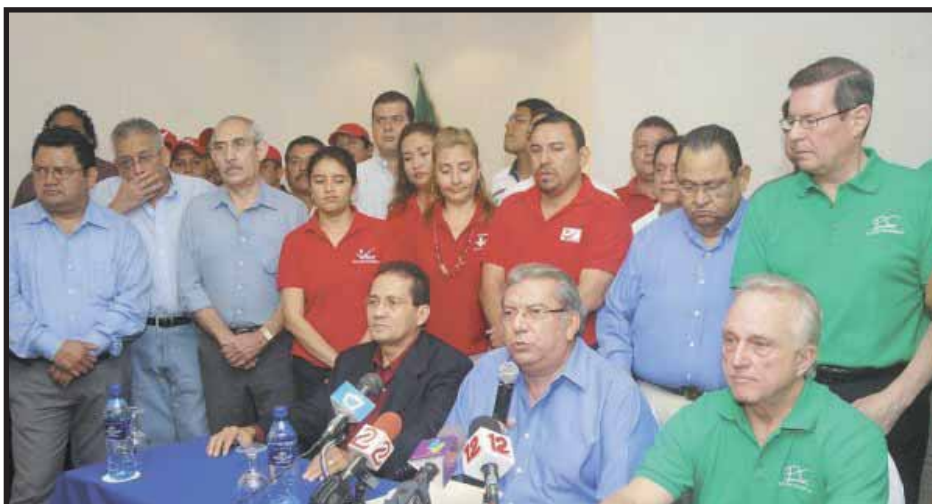
Los conservadores y sus aliados aspiran a ocupar el lugar del PLC

En este estira y encoge, de declaraciones en un sentido pero también en sentido contrario, el ciudadano común y corriente termina mareado, detestando a los políticos marrulleros. Pero el análisis de la realidad, que hemos detallado con anterioridad, nos indica que, por el momento, es poco probable que Arnoldo Alemán se "baje del caballo" y renuncie a la aspiración de correr como candidato a