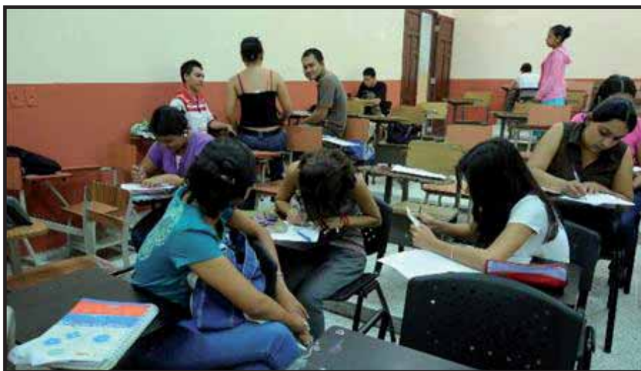
El sistema capitalista le niega el acceso a la educación superior a decenas de miles de jóvenes

Un punto que vale la pena recalcar en la Asamblea es la participación de padres y madres de familia que representaban a sus hijos, dándole más realce a esta