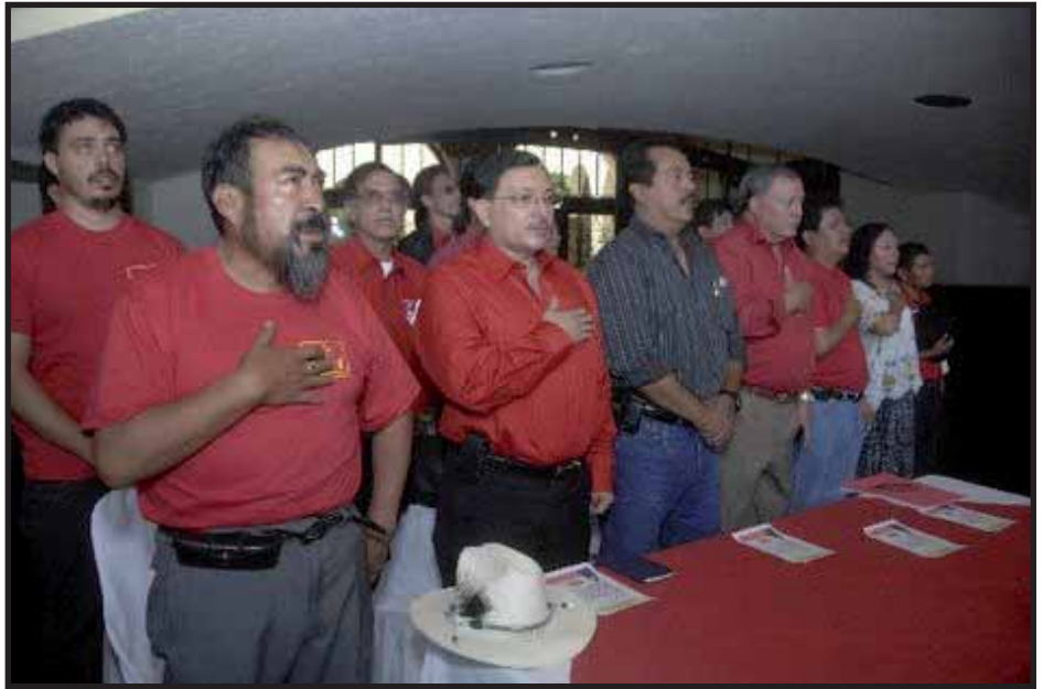
Directivos de Alternativa Nueva Nación (ANN)

Esta vez ambos partidos están esforzándose por crear un proyecto unitario. Desde al menos el segundo semestre de 2009 URNG y ANN anunciaron su unidad de acción, después de zanjar las agrias diferencias que condujeron a la separación años atrás. En 2010 ANN recuperó su legalidad como partido y en mayo fue anunciada la formación de la Mesa Unitaria de Izquierda. Esta mesa, conformada por URNG, ANN, el Frente Popular, el Partido Guatemalteco del Trabajo y el Colectivo Clavel Rojo, divulgó un plan interesante y mucho más concreto que los planteamientos habituales de los partidos de la ex guerrilla. El plan incluía la nacionalización de los recursos estratégicos (agua, minerales, banca), la reforma agraria, la reforma fiscal, la protección del ambiente y los recursos naturales y garantizar la socialización de la riqueza producida. Frente al discurso de democracia real funcional y participativa con justicia social, etc. de ANN y URNG, este plan representaba un adelanto importante. En octubre la Mesa publicó un comunicado, esta vez sin la inclusión del