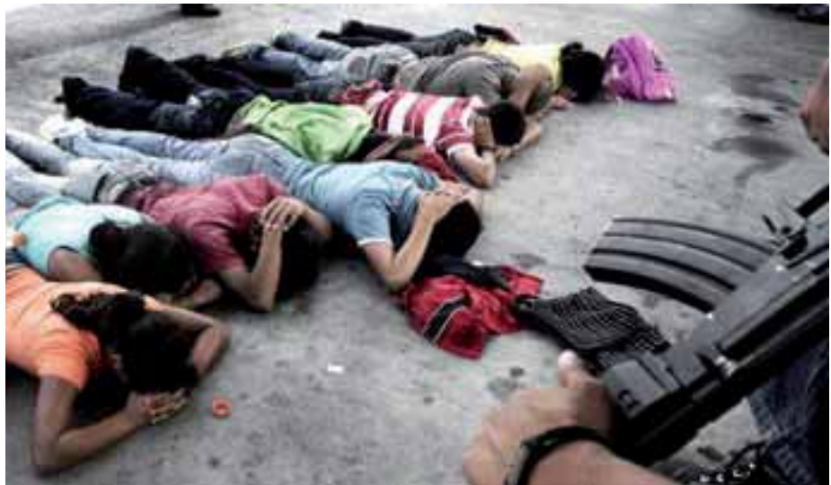
La represión selectiva continúa, la impunidad se mantiene

Todos los casos reportados de violencia terminan muy mal: "durante el período del 2005 al 2009, el Ministerio Público recibió un total de 320,153 denuncias, de las cuales 250,216 fueron remitidas a la DNIC para su debida investigación. Al respecto este ente de investigación únicamente devolvió con informe de investigación 48,626, que equivalen al 19%, quedando en proceso de investigación y posiblemente en la impunidad 201,590 (81%) de los ilícitos denunciados." (Ídem) Como podemos ver, el Estado se ha mostrado incapaz de resolver los delitos reportados, pero lo peor, es que estos altos índices de delincuencia, le plantea al Estado un panorama propicio para que los aparatos represivos continúen violentando los derechos humanos.