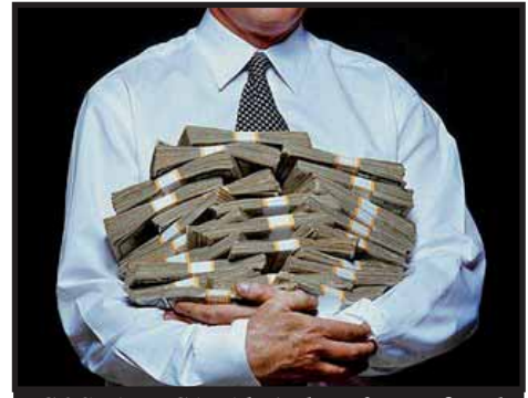
COSTA RICA: Abajo la reforma fiscal de Laura Chinchilla