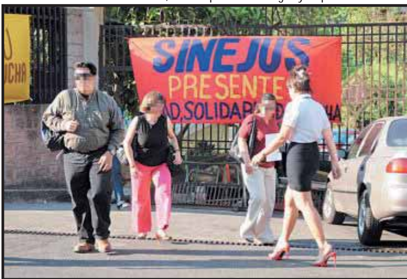
Los empleados judiciales libraron una importante lucha por la defensa de sus conquistas

El PSOCA llama a no confiar en la trampa del dialogo ya que esta es una