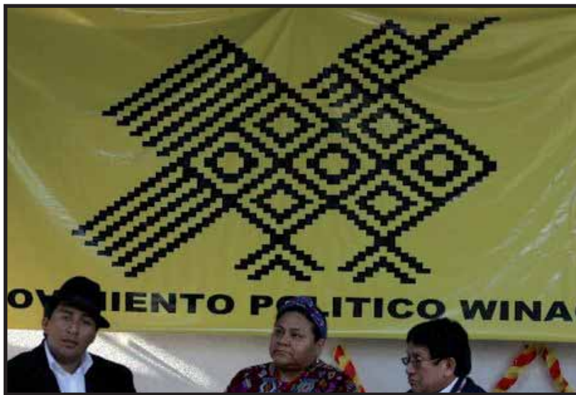
Dirigentes del movimiento WINAQ