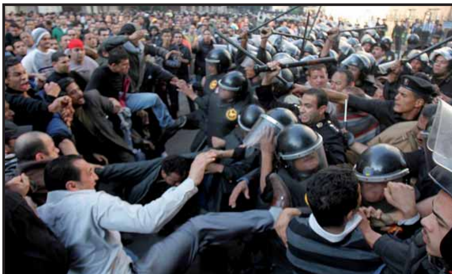
Las movilizaciones hacen tambalear al régimen dictatorial de Mubarak

Sin embargo la fuerza de Mubarak es mayor y por lo tanto las masas tendrán que tener mayor fortaleza para poder hacer caer al dictador. Esto también porque los aliados tal y como se menciona anteriormente son más celosos por la suerte de su aliado.