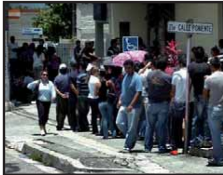
EL SALVADOR: continúa la lucha por el derecho a la educación