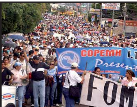
HONDURAS: urge la unidad del magisterio para defender el Estatuto Docente