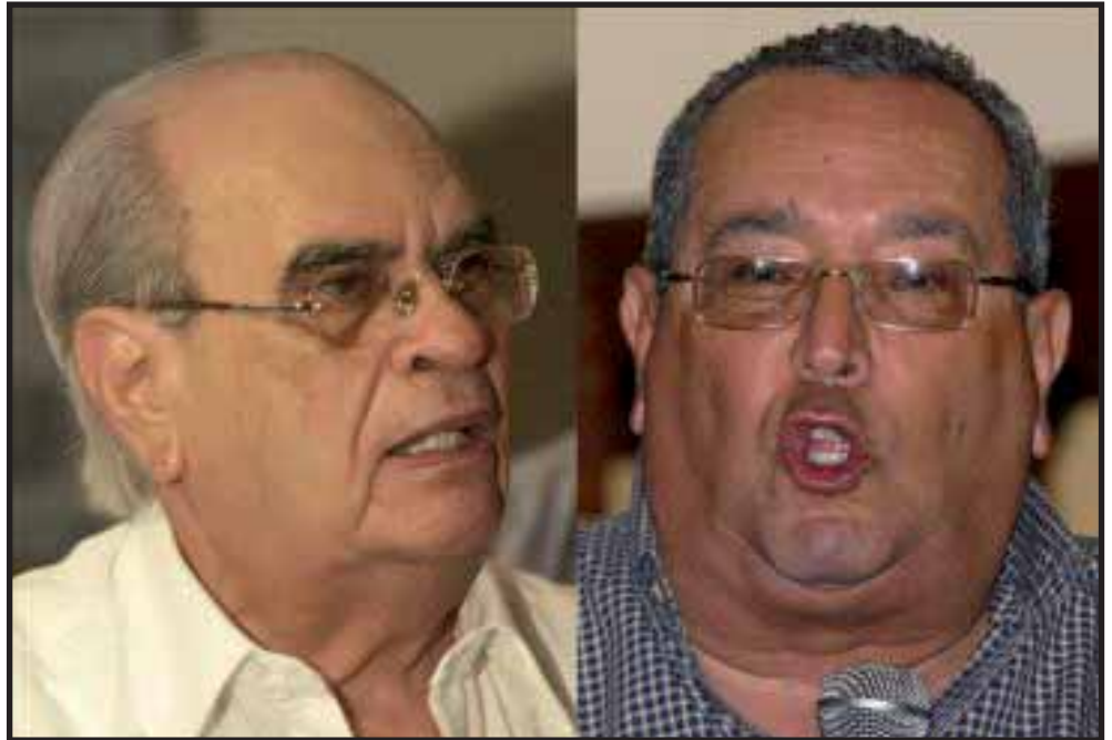
Los consuegros Fabio Gadea Mantilla y Arnoldo Alemán están enfrentados

En la época de Somoza, el sistema bipartidista nunca fue igualitario: la repartición de las cuotas de poder siempre fue en una proporción de dos tercios para el partido de la mayoría y un