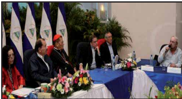
Los empresarios están felices con el gobierno de Daniel Ortega

Al mismo tiempo que mantiene el discurso populista a favor de los pobres y días antes que se reúna el Congreso del FSLN en Managua, Daniel Ortega ha logrado atraerse a su proyecto reeleccionista a la cúpula empresarial. Al menos, así lo demuestra el silencio cómplice de la oligarquía financiera, que está más interesada en los negocios que en la democracia y que ve con buenos ojos la estabilidad política del gobierno sandinista. Ver para creer. ■