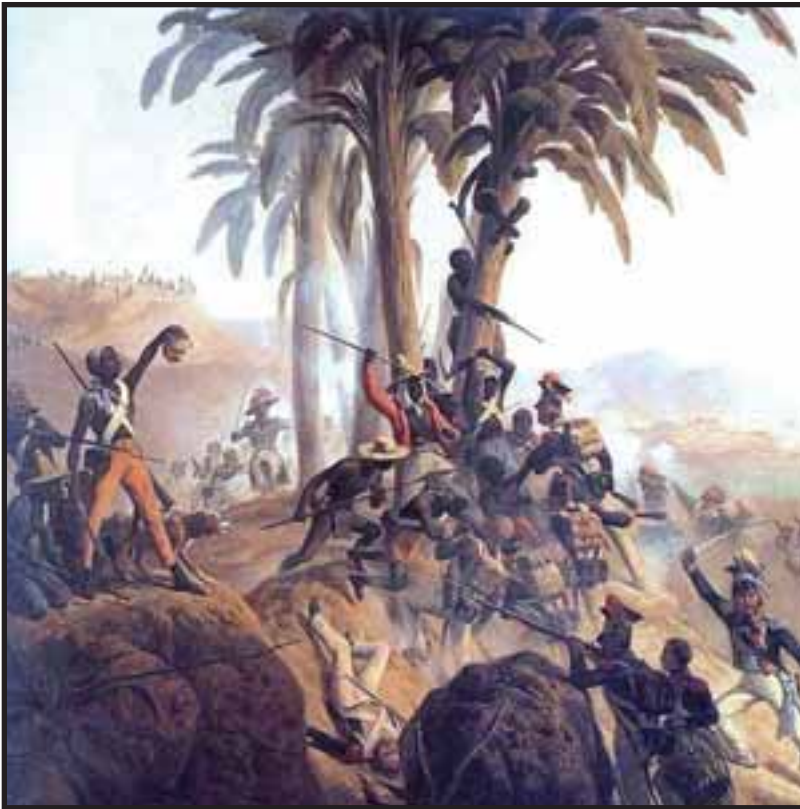
La revolución negra proclamó la República

vitalicio de la colonia, este aplica medidas económicas para revivir nuevamente la economía de plantación, dándole la propiedad a la enriquecida elite negra, a blancos pobres y mulatos, garantizando mano de obra estable por medio de peonaje adscrito a la tierra con trabajo asalariado obligatorio.