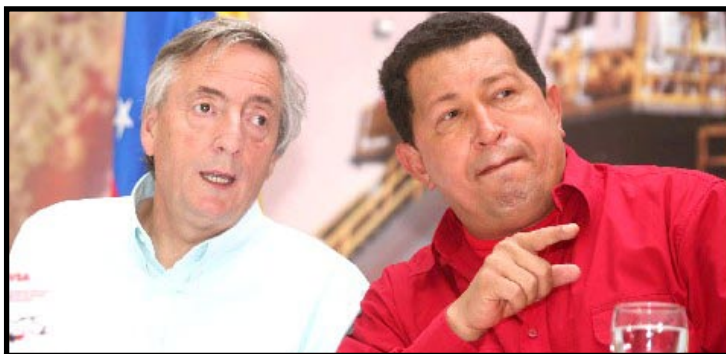
Nestor Kirchner y Hugo Chávez, firmaron un acuerdo energético para explotar las reservas de la cuenca del Orinoco

retorno al viejo régimen de concesiones bajo la modalidad de convenios operativos y "asociaciones estratégicas" para explotar y comercializar el petróleo. Pero fue bajo la segunda presidencia de Carlos Andrés Pérez, en febrero de 1989, que se acordó el "gran viraje" con el Fondo Monetario Internacional y el Banco Mundial, permitiendo el reingreso del capital extranjero en la industria petrolera.