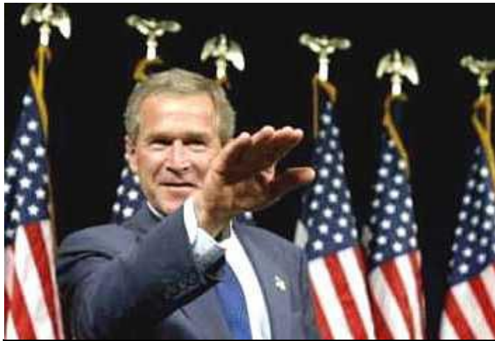
¡Fuera Bush de Guatemala!.- (Pág 3)

"Por la Reunificación Socialista de la Patria Centroamericana"