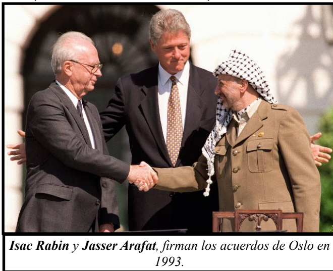
Isaac Rabin y Jasser Arafat, firman los acuerdos de Oslo en 1993.

La presión del imperialismo yanqui y el sionismo para que el Nuevo Gobierno reconozca el Estado de Israel ha sido profunda; el propio Abbas se encuentra entre la espada y la pared al señalar: "Me estáis presionando.