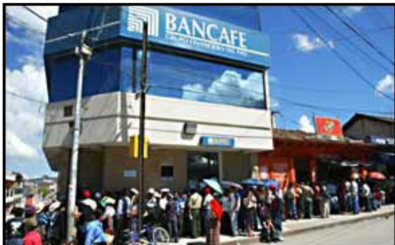
Miles de Guatemaltecos son las víctimas del pillaje en el Bancafe y el BC