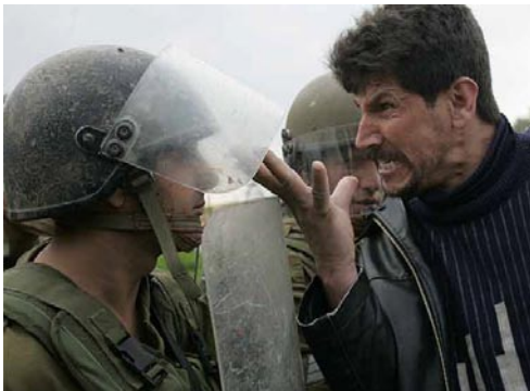
Soldado Israelí se enfrenta a un Palestino.- Internacional

PALESTINA: RETOMAR EL PROGRAMA DE LA OLP PARA DERROTAR AL SIONISMO PÁG.-18