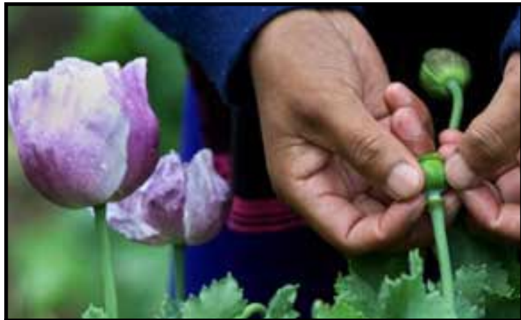
Cultivo de Amapola en el Departamento de San Marcos.

Otro peligro de la presencia gringa es que nuestro territorio sea usado como plataforma de ataque contra la revolución cubana y el proceso revolucionario abierto en Venezuela. Eso ya lo hicieron en 1961 cuando intentaron invadir Cuba y heroicamente el pueblo cubano derrotó esa agresión. No sería extraño que otra vez nuestro país sea usado