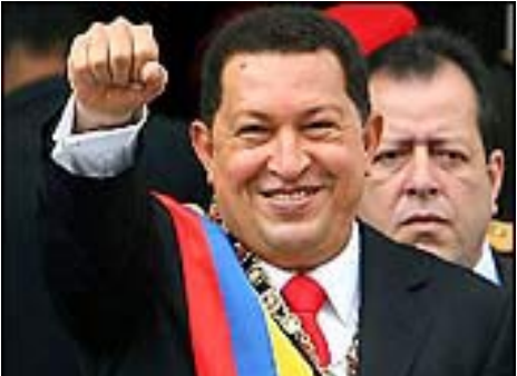
El Socialismo del Siglo XXI: ¡Soy Yo!.- Venezuela (Pág. 12)

PALESTINA: RETOMAR EL PROGRAMA DE LA OLP PARA DERROTAR AL SIONISMO PÁG.-18