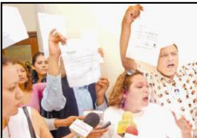
Trabajadores despedidos de la Asamblea Nacional

El grueso de los despidos es a los trabajadores o empleados públicos y no los llamados "trabajadores de confianza" que ganan megas salarios. Y son a esta mayoría de trabajadores humildes, independientemente ya sean liberales o sandinistas, a los que hay que garantizar estabilidad.