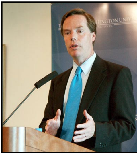
Nicholas Burns, Sub-secretario de Estado de los Estados Unidos.

La concentración de poderes por parte de Chávez ha provocado fisuras en la coalición gobernante: Chávez separó al vicepresidente José Vicente Rangel, y los sustituyó por el incondicional Jorge Rodríguez. Recientemente Rangel rompió el silencio y declaró en doble