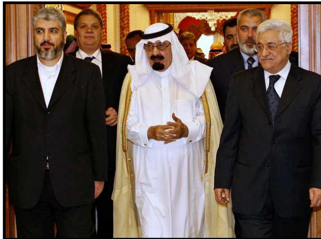
El Rey Abdalá de Arabia Saudita, junto Mahmud Abbas (Al Fatah) y Jaled Meshaal (Hamás)

Las burguesías árabes, al peligrar sus negocios por la inestabilidad, se han prestado a facilitar el "Acuerdo de Gobierno de Unidad Nacional". Prueba de ello fue la reunión en Damasco entre Abbas y Jaled Mescal (Hamás) el pasado 21 de enero en donde: "sólo los intensos esfuerzos del gobierno sirio, y particularmente de su vicepresidente Faruk al Chara, permitieron que se celebrase la reunión, la primera entre Abbas y Mechal desde julio de 2005" (ÍDEM). Igual papel ha jugado el rey Abdalá de Arabia Saudita quién promovió la reunión en La Meca el 7 de febrero, que finalmente desembocaron