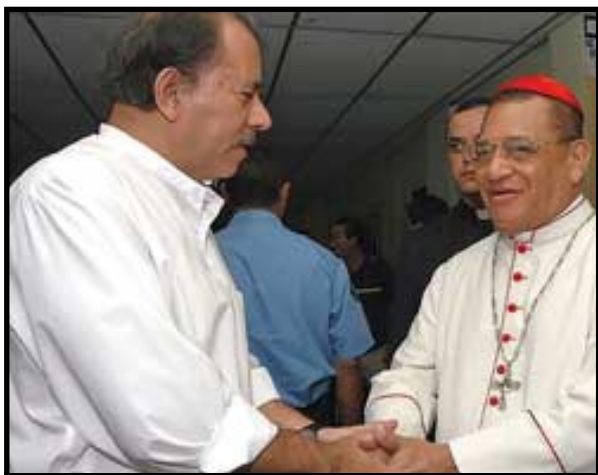
Daniel Ortega y el Cardenal Miguel Obando