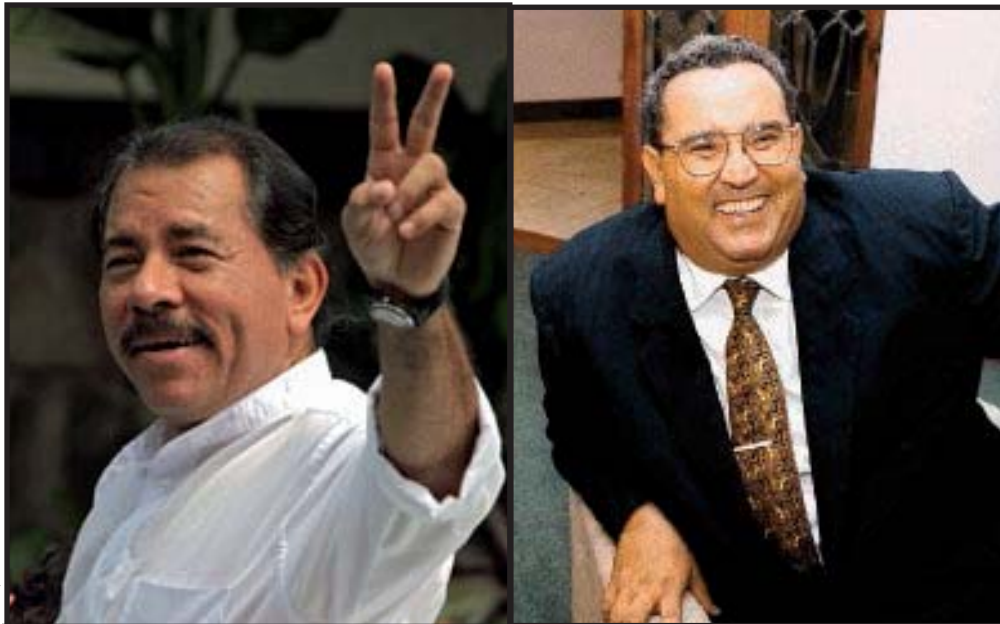
Daniel Ortega Saavedra y Arnoldo Alemán Lacayo, caudillos de las nuevas paralelas históricas.

¿Fue acaso el general Sandino un "caudillo local"? El asesinato de Sandino y el aplastamiento de la guerrilla campesina que le apoyó fue una de las tragedias más grandes que