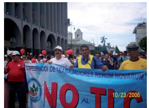
En el laberinto del Referéndum.-Costa Rica (Pág. 10)

Para triunfar cambiemos los métodos de lucha. 4 ¡Que Mel Zelaya nacionalice las generadoras! 5