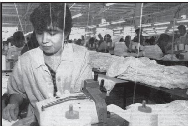
La Maquila es uno de los pilares del nuevo modelo económico.

El nuevo modelo de explotación capitalista ya no se basa en la