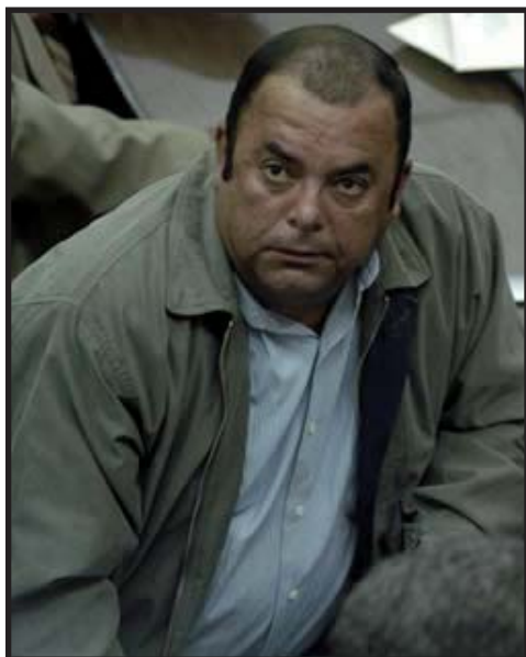
El ex diputado sandinista Gerardo Miranda, señalado de pedir "coimas" para el FSLN.