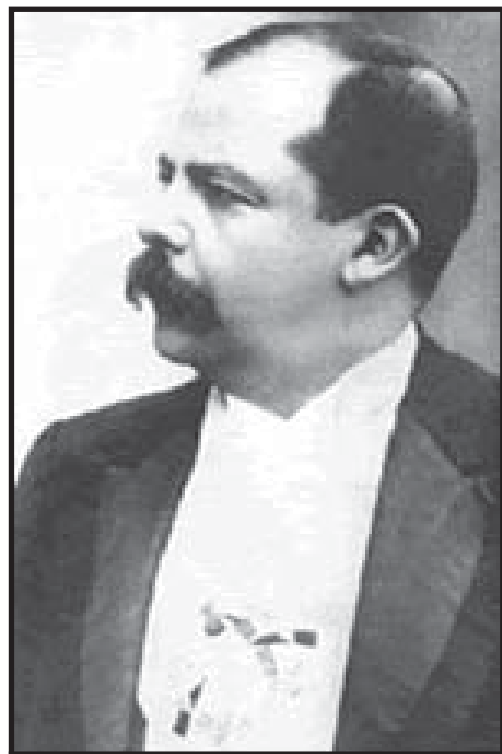
El Dictador Manuel Estrada Cabrera.

Los marxistas revolucionarios reivindicamos la audacia y el valor que tuvieron los héroes del 20 de mayo como cualidades que deben tener el proletariado y las demás capas oprimidas de la población en su esfuerzo por derrocar al capitalismo. Pero no reconocemos el terrorismo individual como método válido de lucha. La liberación de los trabajadores de las cadenas de la explotación es