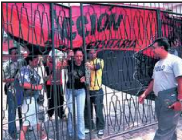
Estudiantes se toman el recinto de la Universidad Pedagógica .

No se puede confiar el reintegro del compañero y el cobro del examen de admisión a las autoridades universitarias, pero en este momento es necesario replegarse y convocar a una asamblea estudiantil, que busque el apoyo de las bases estudiantiles, ya que solo la movilización de la población estudiantil, puede arrancar las justas demandas del estudiantado. ■