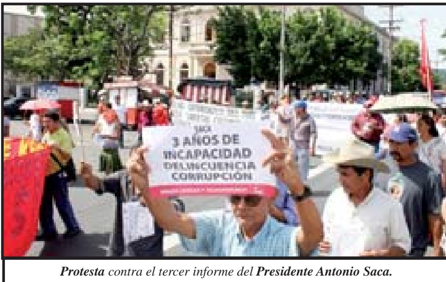
Protesta contra el tercer informe del Presidente Antonio Saca.

Para Saca estos "fondos complementarán las asignaciones del presupuesto nacional y vendrán de un esquema financiero que será alimentado por las aportaciones de ciudadanos, instituciones y empresas públicas y privadas, inversionistas institucionales, nacionales y extranjeros, así como por el Gobierno" (Prensa Grafica 02/06/07)