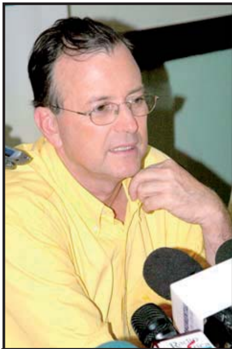
Ottón Solís, líder del PAC.