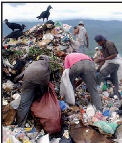
La pobreza se extiende y profundiza bajo el nuevo modelo del capitalismo en Centroamérica.

ampliación y absorción del mercado por parte de las transnacionales, y no fue producto de una política consciente de los gobiernos que recién comenzaban a salir de la marejada revolucionaria de los años 80.