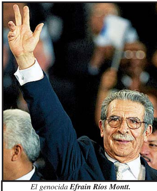
El genocida Efraín Ríos Montt.

Supuestamente tendría que ser aprobado en la primera quincena del mes de junio, pero hasta el momento que estamos escribiendo estas notas (13 de junio), no ha tenido aún la aprobación del pleno del congreso. Todos los partidos habían dado ya su visto bueno, pero a última hora la ultraderecha reaccionaria, GANA, PP, FRG, PAN, PU, es decir los que representan los intereses del gran capital y sobre todos los señalados en la primera parte del artículo (FRG y