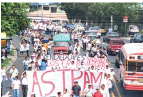
Vendedores marchan por la defensa de sus derechos.- El Salvador (Pág 16)

Asesinato del Mariscal Tujachevsky y el Descabezamiento del Ejército Rojo. 20