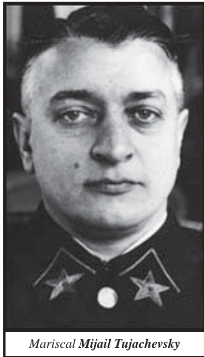
Mariscal Mijail Tujachevsky

El pasado 12 de junio, se cumplieron 70 años del asesinato del celebre mariscal Tujachevsky y siete generales del ejercito rojo. Fue en el mes de junio de 1937, que Iosef Stalin ordenó la gran purga del Ejercito Rojo que llevaría al paredón no solo al gran mariscal, sino a toda una generación de estrategas y baluartes militares, forjados bajo el insondable fuego de la revolución bolchevique, la guerra civil y la lucha contra la invasión de los 14 ejércitos imperialistas a la Unión Soviética.