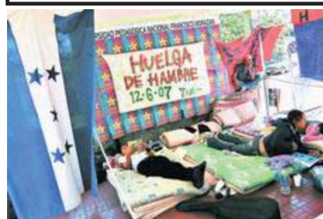
Alumnos de la Pedagógica en Huelga de Hambre.- Honduras (Pág. 04)

Honduras: ¡Que Mel Zelaya Nacionalice las empresas generadoras de energía!