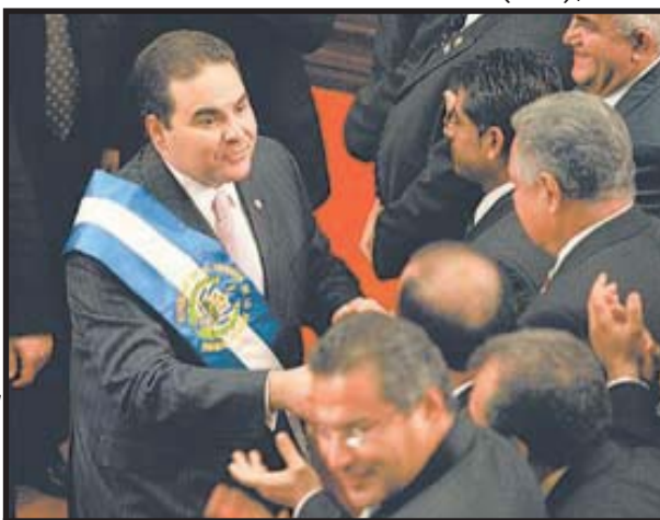
El Presidente Antonio Saca saluda a sus partidarios después de rendir su tercer informe ante el Congreso.

Este último aspecto reviste extrema importancia en una economía en donde desapareció el colón, antigua