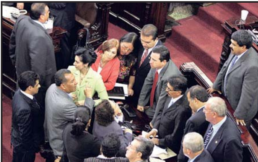
Diputados del Frente Republicano Guatemalteco (FRG), como era de esperarse, se negaron a votar a favor de la CICIG

secretario de estado adjunto para asuntos del Hemisferio Occidental del gobierno gringo. Shannon vinculó, en una amenaza velada, la aprobación de la CICIG con el aumento de la ayuda internacional. Por ello exigimos que en la comisión no sólo estén representantes de la imperialista ONU y del gobierno, sino miembros de las organizaciones populares, de trabajadores, campesinos e indígenas, quienes son los verdaderos interesados en el control del crimen organizado y las bandas armadas de la ultraderecha. ■