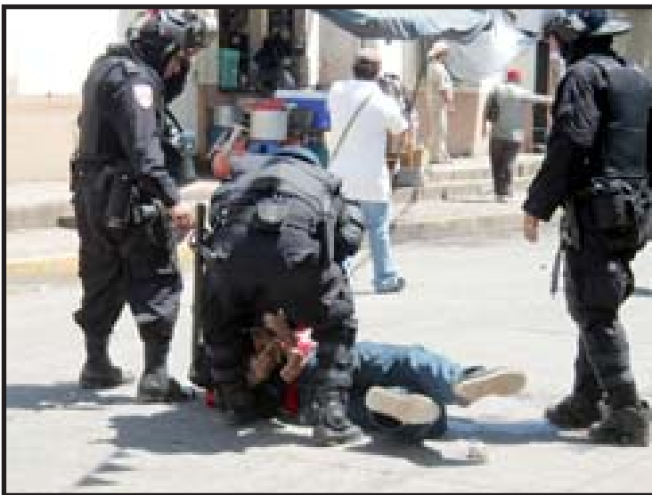
La UMO de la PNC reprime a los manifestantes.

En 1977, bajo la dictadura militar del general Humberto Romero, fue promulgada la Ley para el Mantenimiento del Orden, con el objetivo de para el ascenso revolucionario que se vivía en el país. La repuesta fue la radicalización y las masas tumbaron a la dictadura. Aunque no vivimos una situación similar, es obvio que se requiere