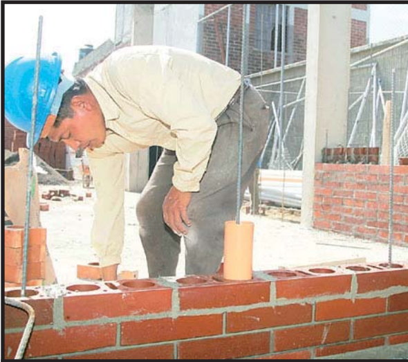
La Clase Obrera Guatemalteca es la que mas resiente el alto costo de la vida.

Según el último reporte del Índice de Precios al Consumidor, la inflación en lo que va de 2007 ha sido de 3.74%. En el rubro de alimentos y bebidas, el alza ha sido de 4.53 %, y 8.13% en los últimos doce meses. Para los obreros, asalariados y demás sectores de las clases populares guatemaltecas esto significa que la canasta básica de alimentos ha aumentado en Q46.56, ascendiendo a Q1,574.05 para una familia de cinco miembros. Esta cantidad casi iguala al salario mínimo, que es lo más que puede aspirar a ganar un gran porcentaje de nuestra mano de obra