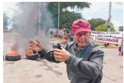
Continúan protestas contra Unión Fenosa.- Nicaragua (Pág.-24)