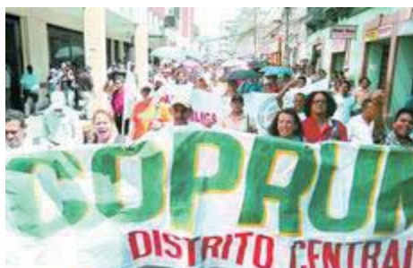
Magisterio se prepara para la gran marcha nacional.- Honduras (Pág. 03)