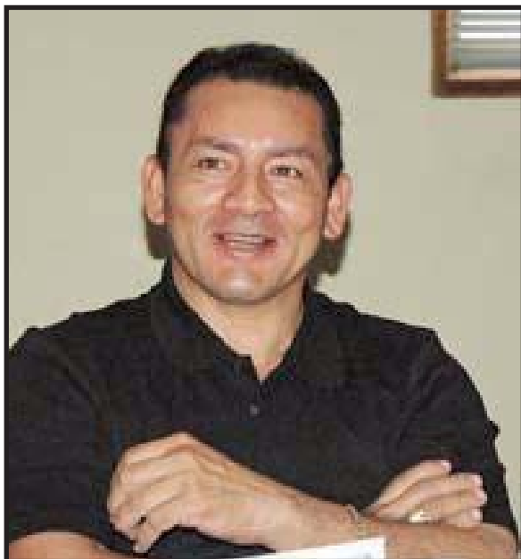
¿Cuanto tiempo durará la rebelión de Maximino Rodríguez?