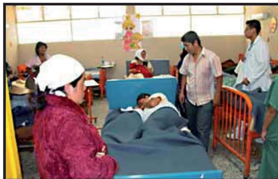
Condiciones deplorables del Hospital de Huehuetenango.

El año pasado una situación similar de desabastecimiento en los hospitales nacionales desató una huelga de médicos que duró casi 9 meses. La crisis actual reúne las condiciones para otro movimiento de protesta. A pesar de la transferencia de presupuesto, la situación de debacle en la red hospitalaria continuará porque es una crisis estructural. Llamamos al sindicato médico, de trabajadores de la salud, organizaciones estudiantiles y populares a iniciar pláticas para gestar un nuevo movimiento nacional de lucha y protesta contra el gobierno de empresarios que menosprecia la salud del pueblo. ■