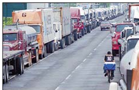
Huelga de Choféres.- Guatemala (Pág.16)

¡¡Abajo la Ley Antiterrorista y su reforma!!