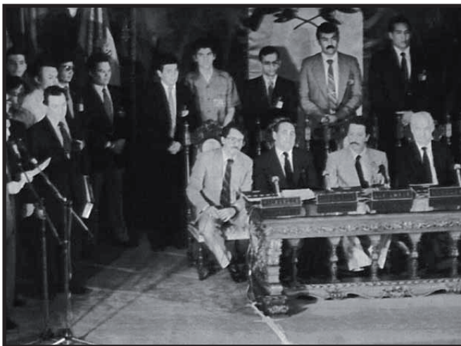
7 de Agosto de 1987: Firma de Esquipulas II.

Secretario de Estado, Henry Kissinger, con el objetivo de formular políticas en relación al conflicto en América Central. La escogencia no fue un capricho, ya que Kissinger ha sido probablemente el más astuto y brillante diplomático del imperialismo norteamericano en el siglo XX.