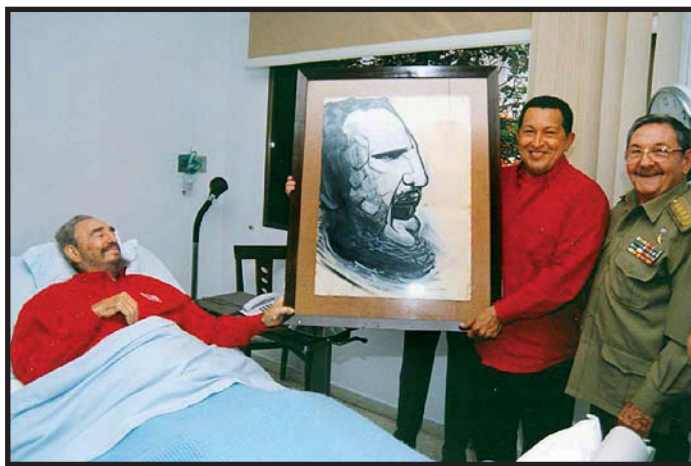
Fidel Castro, Hugo Chávez y Raúl Castro..

El pasado 26 de julio, proclamó la necesidad de “transformar