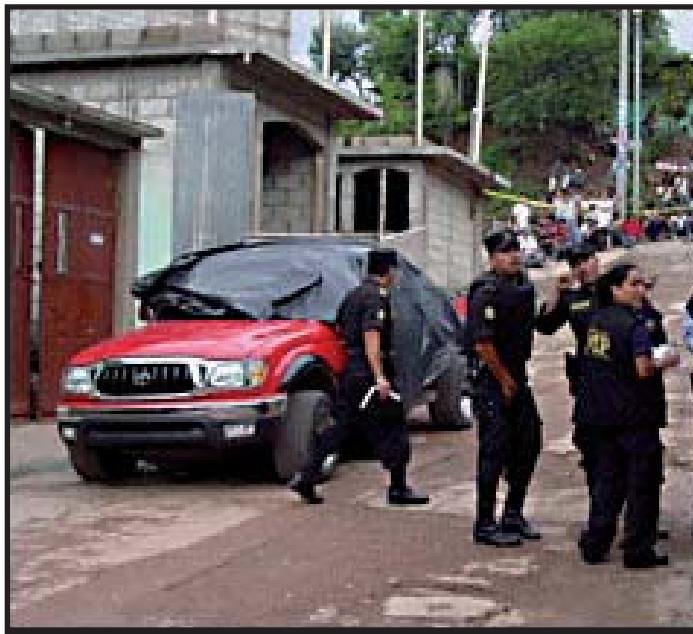
Vehículo en el que fue acribillado a balazos Werner Velásquez , Alcalde de Santa Ana Huista.

Los marxistas revolucionarios exigimos al gobierno que ponga freno a la violencia electoral. Berger y su equipo, que pomposamente se anunciaron al inicio de su mandato como “gobierno de empresarios” han fracasado rotundamente en controlar al crimen organizado y no han hecho nada para dismantlar los organismos armados clandestinos de la ultra derecha. La postulación a cargos públicos sin temor a ser víctima de ataques es un derecho democrático básico de los ciudadanos guatemaltecos que nosotros reivindicamos y defendemos. ¡Basta ya de asesinatos! ¡Exigimos seguridad para todos los candidatos!