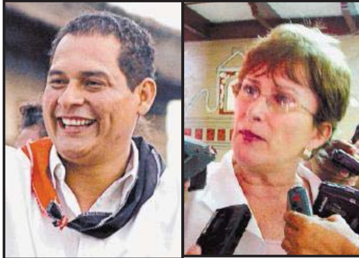
Tránsito Téllez y Dora María Gurdíán, Alcalde y Vicealcaldesa de León.

Ante tantos escándalos de corrupción, el Frente y sus aliados están preocupados por la impresión que causan estos bullicios en la percepción popular de cara a las elecciones. Por esta razón en un año preelectoral el sandinismo busca como aparecer limpio ante los futuros votantes.