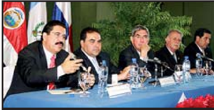
Los Presidentes Centroamericanos, excepto Daniel Ortega, festejaron el 20 aniversario de Esquipulas II.

A partir de la firma de Esquipulas II, el gobierno sandinista comenzó a revertir aceleradamente la independencia política que había conquistado el 19 de julio de 1979, porque comenzó a orientar su política externa e interna en función de los acuerdos diplomáticos auspiciados por los Estados Unidos.