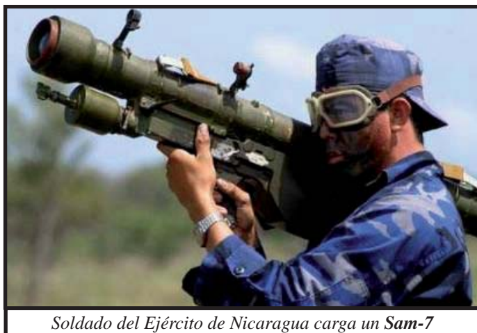
Soldado del Ejército de Nicaragua carga un Sam-7

Ortega reconoció que el trueque de los misiles por helicópteros "ya está descartado", pero se podría realizar un canje "por aparatos de tecnologías de última generación para reforzar los hospitales". El intercambio de misiles por medicinas, equipos médicos de alta tecnología y última generación, resultó sumamente atractivo para los Estados Unidos. La repuesta de Tom Casey, portavoz asistente del Departamento de Estado, no se hizo esperar: "acogemos las declaraciones hechas por el presidente nicaragüense de que están interesados en ser responsables de enfrentar este tema y ver que esas armas sean destruidas". (La Prensa 3 de Agosto).