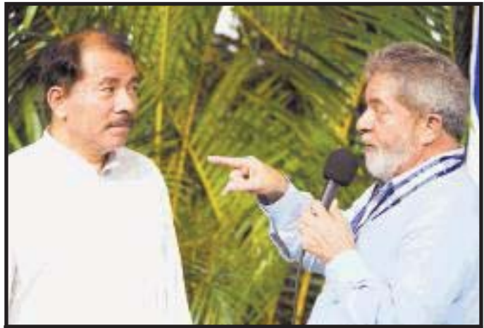
Lula da Silva llegó a dar "consejos" a Daniel Ortega.

Esta percepción hace que lo "enfrenten" a Hugo Chávez, quién por medio de sus petrodólares se ha forjado una influencia importante en el cono sur y Centroamérica. Las