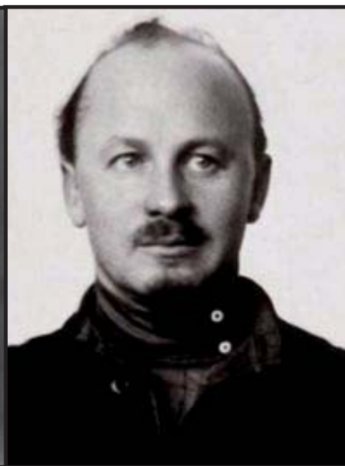
Gregory Zinoviev, Lev Kamenev y Nicolai Bujarin, miembros del Buró Político del Partido Bolchevique en la época de Lenin, todos asesinados por Stalin.

Lósif Stalin y de los peores crímenes en contra del primer Estado Obrero.