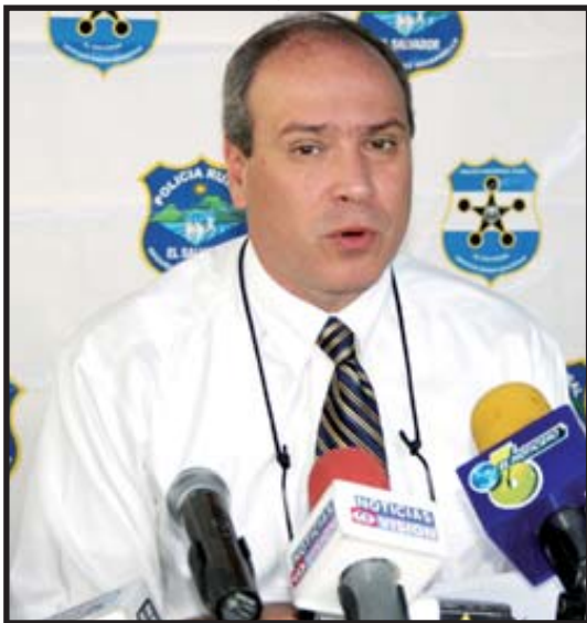
Rodrigo Ávila, jefe de la Policía Nacional Civil (PNC)

A finales de julio, Rodrigo Avila, director de la PNC dio a conocer la existencia del Centro Nacional Antipandillas, una unidad de inteligencia, análisis y operación, bajo el mando de la PNC, comparte información bilateralmente con Estados Unidos, Honduras y Guatemala. Esta unidad cuenta por lo menos con seis agentes