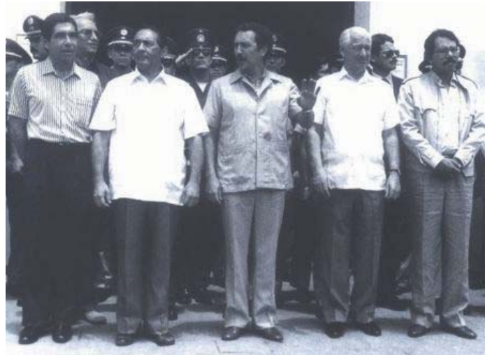
1987: Firma de "Esquipulas II" (Pág.- 12)

PAZ IMPERIALISTA, MISERIA SOCIAL Y CAFTA.