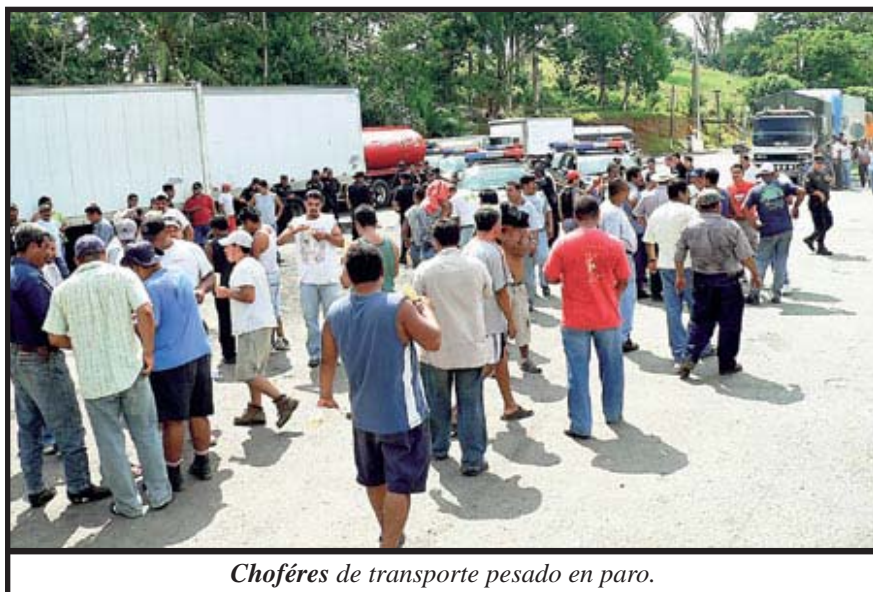
Choféres de transporte pesado en paro.