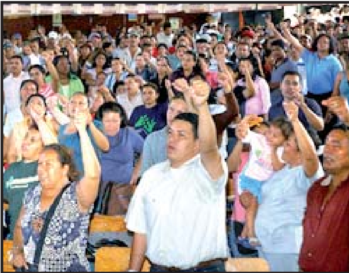
Sindicatos y Colegios Magisteriales anunciaron su participación en la marcha nacional de protesta.