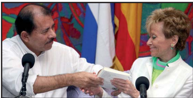
Daniel Ortega y María Teresa Fernández de la Vega, vicepresidenta de España, quién abogó a favor de Unión Fenosa.