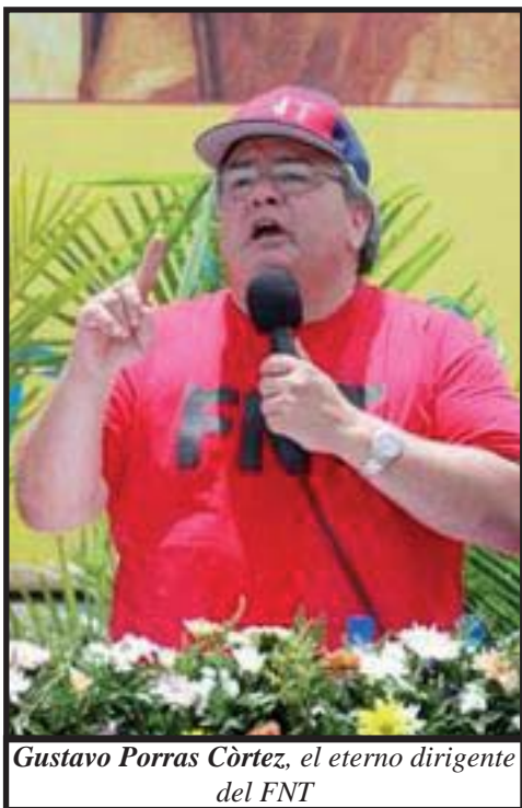
Gustavo Porras Còrtez, el eterno dirigente del FNT

El presidente de la Federación Nacional de Trabajadores (FNT) y también diputado sandinista Gustavo Porras, ha tratado de impulsar una reforma a la Ley de Salario Mínimo, para que este cubra el 100% de la canasta básica. Para abril del 2007