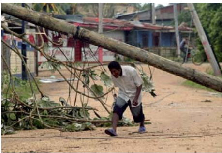
El huracán "Félix" asoló la Costa Caribe.- Nicaragua (Pág. 17)

A 186 Años: A conquistar la verdadera independencia, luchemos por la reunificación socialista de la patria centroamericana