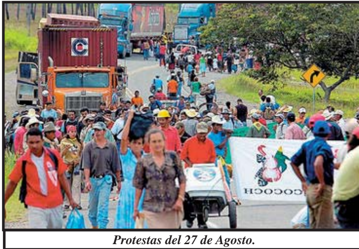
Protestas del 27 de Agosto.

que intentan menoscabar y sacar provecho del éxito del paro nacional, las movilizaciones del 27 expresan en las calles el sentir de la mayoría de la población hondureña, que se ve agobiada por el alto costo de la vida y la explotación atroz que hace la burguesía de los recursos del país para su propio beneficio. Como lo expresaba el dirigente Juan Barahona "Estamos en las calles porque queremos respuestas, nosotros estamos hartos de ir al Congreso Nacional, estamos hartos de ir a Casa Presidencial y que no se nos escuche, entonces tal vez tomándonos carreteras puede haber más presión para que el pueblo se dé cuenta que este gobierno es sordo y ciego, que no gobierna para los pobres". (LA Prensa 28/08/07)