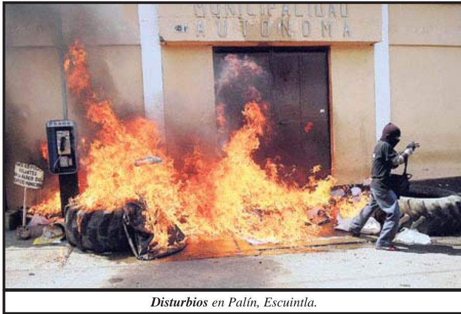
Disturbios en Palín, Escuintla.

que representen sus intereses y que sus liderazgos sean resultado de eso y no terminen pactando con la derecha. Es también importante hacer un llamado a URNG-MAIZ y sus organizaciones miembros para que replanteen la estrategia en el sentido de no absolutizar la vía electoral como la única y prioricen la organización popular, así como que vayan al encuentro del sentimiento de respeto que pide la población engañada por los fraudes. ■