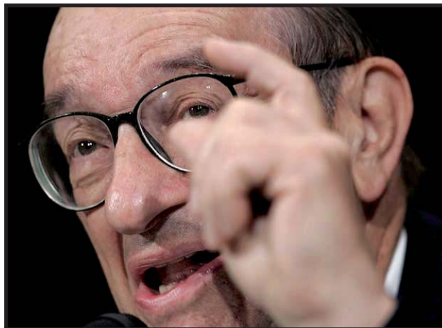
El ex cabecilla de la Reserva Federal, "El Gurú" Alan Greenspan, criticó duramente a Bush.

abandone el país árabe (...) Sólo el 35% de los consultados declaró que el Gobierno debería mantener las tropas en Irak hasta que la situación mejore. Y dos de cada cinco preferían