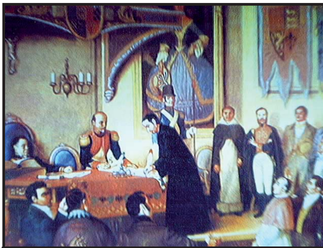
Firma del Acta de Independencia de las Provincias Centroamericanas en Guatemala.

La República Federal de Centroamérica, duraría hasta 1938, en su corta vida, la oligarquía tanto liberal como conservadora fueron incapaces de sostener la independencia y la unidad de todos los Estados. Es importante mencionar, que las luchas que se dieron por el poder entre 1824 y 1838 y que desembocaron en la disolución del estado federal, las libraron fracciones de la oligarquía centroamericana. La