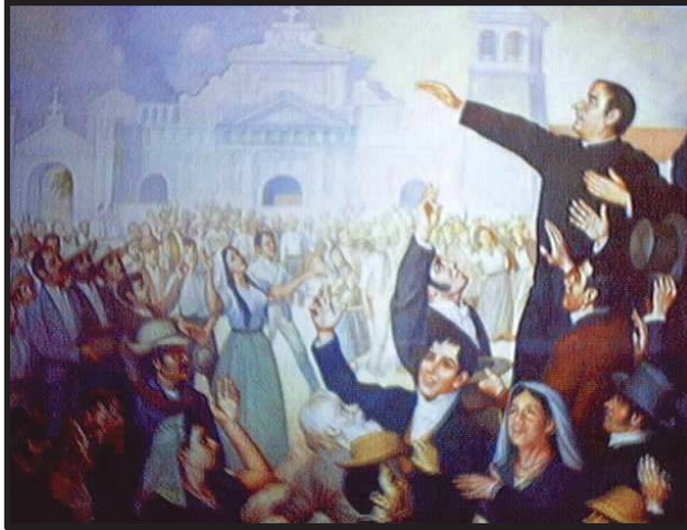
15 de Septiembre de 1821.-. Proclamación de la Independencia.

Horrorizadas las oligarquías centroamericanas deciden intervenir en el conflicto, logrando que los liberales y conservadores firmen el Pacto Providencial, que dio origen a un gobierno provisional centrado en las fuerzas en la guerra contra