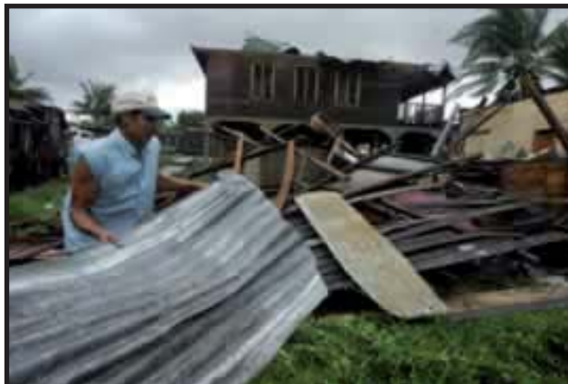
"Félix" dió el "golpe de gracia" a la ya sufrida población costeña.

internacional (UE, EE.UU., Venezuela) y nacional (empresa privada) comenzó a fluir. Así mismo, organismos como el BID han ofrecido programas millonarios para "ayudar". El gobierno sandinista que atraviesa una situación económica complicada, ve en este flujo de "liquidez" una verdadera mina de oro, buscando repetir la "piñata del Mitch". En 1998 el gobierno de Arnoldo Alemán fue "refrescado" por las donaciones para los damnificados del huracán Mitch, millones de dólares ingresaban diario para ayuda humanitaria, de estos millones Alemán dio de comer a su incipiente "burguesía liberal criolla"; ahora el FSLN sin duda busca lo mismo.