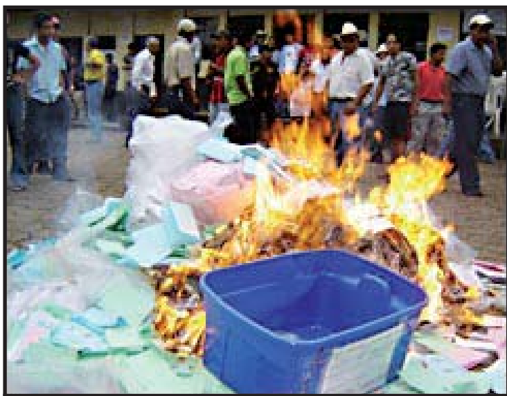
Inconformes queman urnas en El Cerinal, Santa Rosa