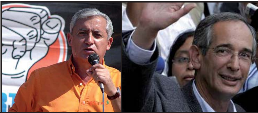
Otto Pérez Molina y Álvaro Colom, la dos cara de la misma moneda: el programa de la Burguesía.

Molina se preparan para la segunda vuelta esforzándose por ganar el apoyo de los alcaldes y diputados de los demás partidos de la burguesía, ofreciéndoles financiamiento para sus proyectos y otras prebendas. Los partidos de derecha que fueron derrotados no han dado su apoyo oficial a ninguno de los dos candidatos, por ello la pelea es por ganar a los cuadros medios y funcionarios electos. Los socialistas revolucionarios denunciamos a los candidatos del imperialismo y la burguesía y llamamos al pueblo trabajador a rechazarlos votando nulo. ■