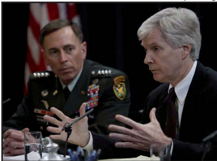
El General David Petraeus y el embajador de EE.UU. en Irak Ryan Cooker comparecieron ante el Congreso.

La pacificación de Irak se ha visto imposibilitada; no porque las milicias islámicas sean un oponente poderoso, EE.UU. aunque posee el ejército más poderoso del mundo no puede masacrar a las milicias iraquíes, debido a la conciencia pacifista y reformista de las propias masas estadounidenses.