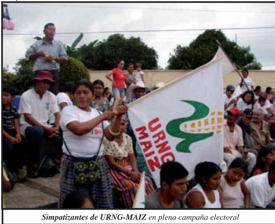
Simpatizantes de URNG-MAIZ en plena campaña electoral

cada cosa en su lugar; de extraer las enseñanzas de la experiencia de la revolución burguesa de 1944-54 y de la lucha guerrillera; de definir un programa socialista revolucionario que rompa con el reformismo estéril de URNG y ANN. Llamamos a la izquierda revolucionaria, la que rechaza el electoralismo y el reformismo, a preparar un foro de discusión para conformar un frente anticapitalista de clase, para organizar y movilizar a las masas y realizar el trabajo revolucionario que corresponde a los que estamos a favor del socialismo. ■