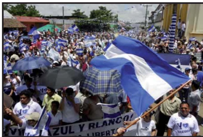
Marcha del 9 de Septiembre en Masaya.

Esta vez, acompañó la marcha nacional la llamada "Coordinadora Civil", un organismo dirigido por un puñado de sandinistas "críticos" que