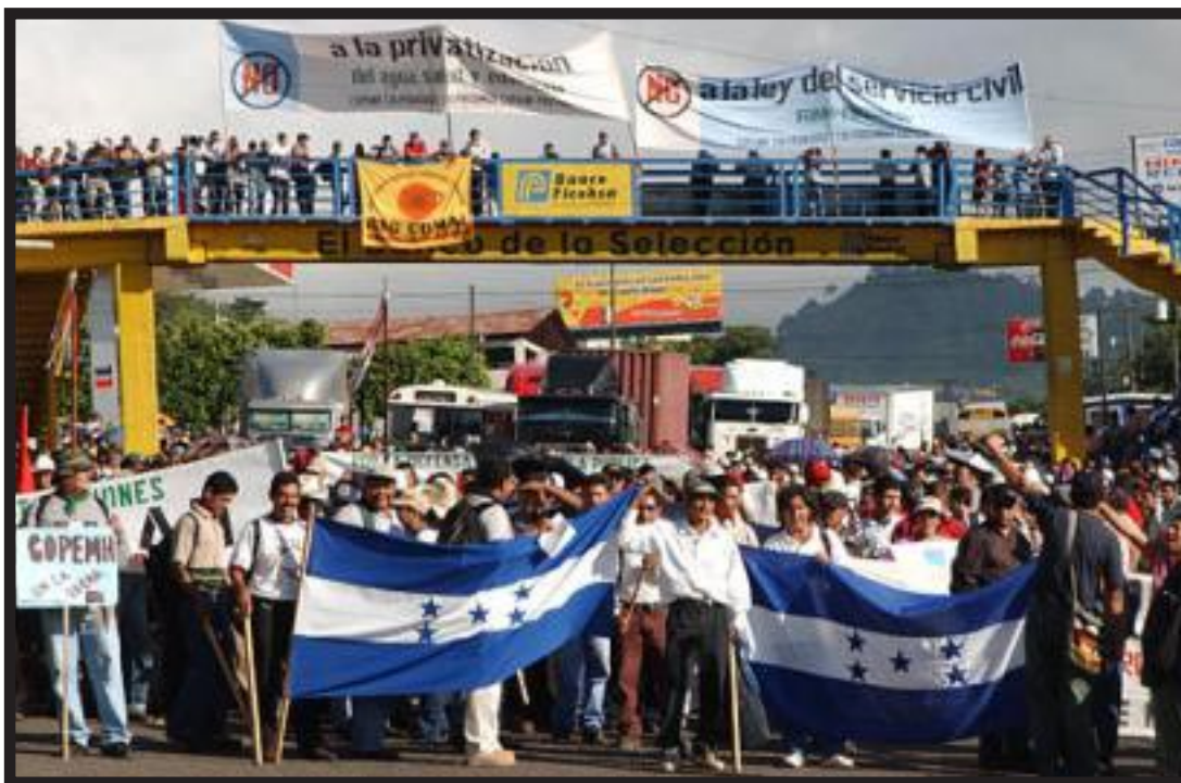
Vista de la salida a San Pedro Sula donde más de 5 mil manifestantes provenientes de la zona norte tuvieron bloqueada la carretera por espacio de 8 horas

La movilización involucró a más de 20 mil manifestantes de la capital y de unos 12 departamentos (Colón, Atlántida, Yoro, Cortés, Santa Bárbara, Lempira, Intibucá, Comayagua, Fco. Morazán, Olancho, El Paraíso y Choluteca) organizados en la Coor-