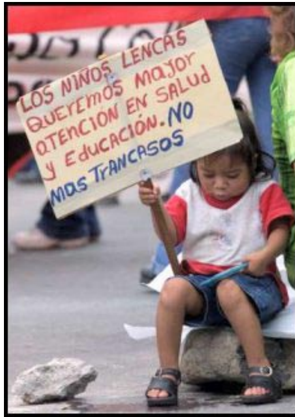
Por la dignidad nacional, ¡Fuera el FMI!

3. Abajo el Gran Diálogo Nacional. El Diálogo impulsado por el gobierno es una trampa para desviar la lucha unitaria hacia el