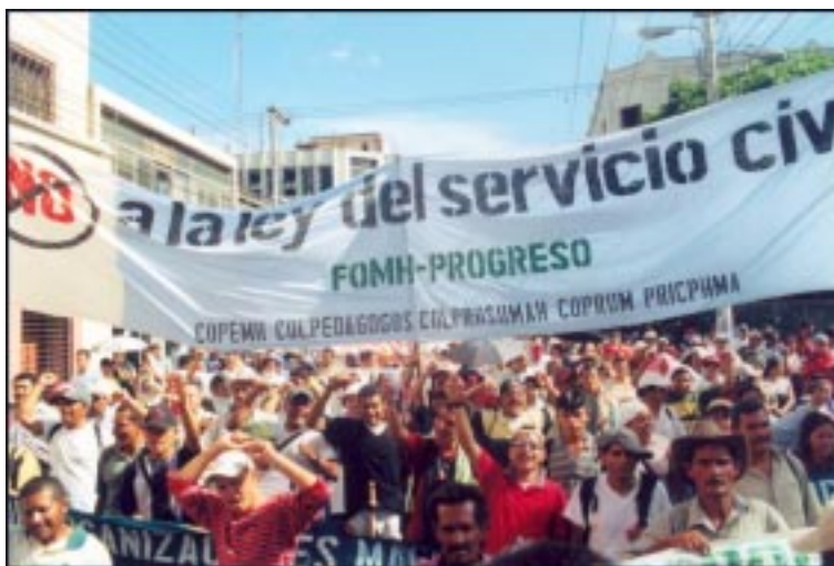
Por la defensa del agua, la tierra y el salario

La deslegitimación del Gran Diálogo Nacional propuesto por el Gobierno y el surgimiento de una estructura unitaria de lucha como consecuencia directa de la Jornada del 26 abren la posibilidad de empezar a derrotar la política del gobierno. Para ello es fundamental que las organizaciones