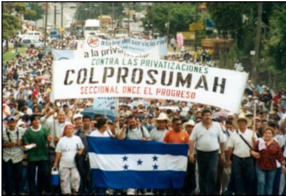
Miles de manifestantes marchan hacia el Congreso

La masividad de la protesta pudo más que las políticas, maniobras y represiones del gobierno y hasta la presidencial llegaron los gritos espontáneos de los manifestantes: “ M a d u r o . . .