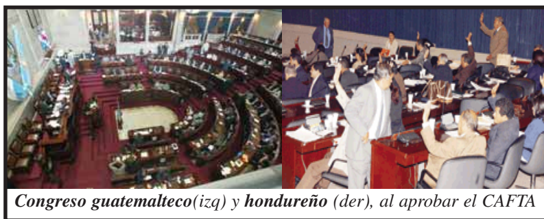
Congreso guatemalteco(izq) y hondureño (der), al aprobar el CAFTA

Evidentemente los gobiernos y los organismos financieros intentarán paliar los efectos negativos del tratado dando pequeñas migajas de dinero. La Prensa informa que el gobierno de Ricardo Maduro va a otorgar 600 millones de lempiras “para auxiliar de manera inmediata a la micro y pequeña empresa.” (...) “Para el mismo sector, aseguró, que la GTZ de Alemania ya prometió aportar 6.2 millones de euros.” (La Prensa, 4/03/05) Este