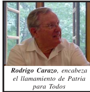
Rodrigo Carazo, encabeza el llamamiento de Patria para Todos

de esa organización no se pronunció en contra de la corrupción ni ha realizado ninguna crítica en contra de sus dirigentes. Estos hechos serán pagados por esta agrupación en las próximas elecciones. Las recientes elecciones distritales del PUSC tuvieron poca participación, lo que demuestra la crítica situación de esa organización. Según