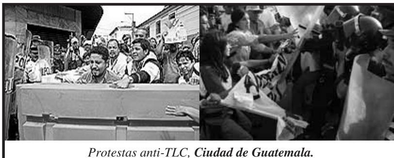
Protestas anti-TLC, Ciudad de Guatemala.

Asimismo, la aprobación de ese tratado significa una serie de transformaciones estructurales. La aprobación del tratado, tanto en El Salvador, como en Honduras y Guatemala va acompañado