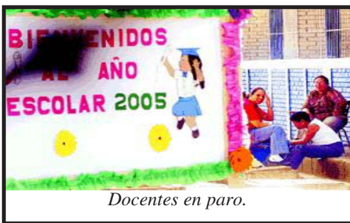
Docentes en paro.

podría llevar el peligro de destitución de los ministros, debido a la santa alianza de los diputados sandinistas y liberales.