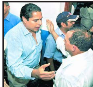
Miguel Pastor y Porfirio Lobo, jefes de los Movimientos en contienda

El Bloque Popular, el Congreso del Pueblo y los demás movimientos sociales que llaman a oponerse a los tratados de libre comercio, deben conjuntamente con la Coordinadora Nacional de Resistencia Popular definir una propuesta electoral clasista de ruptura con los partidos burgueses.