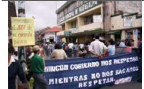
Huelga Magisterial.-Matagalpa, Nicaragua

¡SOLO LA MOVILIZACIÓN OBRERA Y POPULAR PARARÁ EL CAFTA!