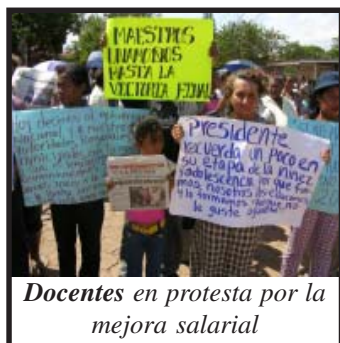
Docentes en protesta por la mejora salarial

sociales en una huelga salvaje del magisterio a comienzos de los años 70. Posteriormente, la dictadura impuso la derrota. El triunfo de la revolución sandinista no significo mejoría económica para el gremio, sino todo lo contrario: mas sacrificios y un férreo control por parte de ANDEN, el sindicato controlado por el FSLN, al grado tal que el año 1988 los maestros prácticamente se sublevaron contra el gobierno sandinista, el que se vio forzado a hacer algunas concesiones materiales. En este periodo fue que surgieron los sindicatos "democráticos", controlados por los partidos de derecha