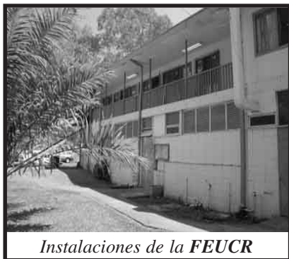
Instalaciones de la FEUCR

La ocupación además de los estudiantes afectados, contó con el apoyo de grupos de estudiantes de ciencias sociales y letras, que se sumaron a la movilización, la ocupación se extendió cuando los estudiantes de Residencias Universitarias, se