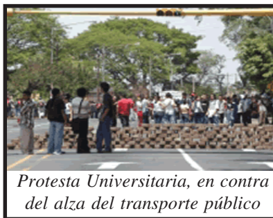
Protesta Universitaria, en contra del alza del transporte público

El pueblo debe reclamar en las calles, de forma organizada todas estas demandas al gobierno liberal de Bolaños, y exigir a los pactistas de la Asamblea que apruebe las leyes necesarias para que el pueblo trabajador tenga una vida digna.