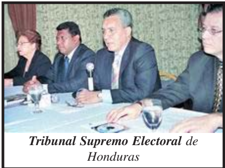
Tribunal Supremo Electoral de Honduras

El Partido Nacional, ganador de las elecciones del año 2001, no logró mayoría simple propia en el Congreso y se vio obligado a negociar con la Democracia Cristiana, que puso sus diputados al servicio de los nacionalistas. Este hecho, ocurrido por primera vez en la historia de Honduras, fue un campanazo de alerta para los partidos burgueses mayoritarios que vieron cómo se empezaba a resquebrajar el bipartidismo.