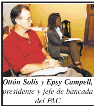
Ottón Solís y Epsy Campell, presidente y jefe de bancada del PAC

También tenemos que decir que todos esos sectores burgueses de la eventual coalición, no son homogéneos, pero la mayoría representan a diversos sectores de la burguesía que produce para el mercado interno y que saben que serán destruidos con la posible aprobación del TLC. De ahí que, casi todos, coinciden