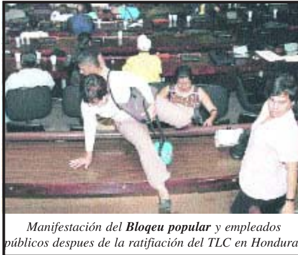
Manifestación del Bloqueo popular y empleados públicos después de la ratificación del TLC en Honduras.

PATRIOTA, UNIONISTAS, PAN, DIA, INTEGRACIONISTAS y la UNE permitió la ratificación, 126 votos