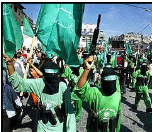
Demonstración de las Milicias de Hamás

Los ataques al pueblo palestino y libanés, responden al proyecto del imperialismo estadounidense, que busca "remodelar el Medio Oriente", "democratizando" la zona combinando la vía armada y la presión financiera / diplomática, eliminando así la incómoda o posición burguesa árabe, para esto necesita impulsar a los sectores burgueses pro estadounidense en la región.