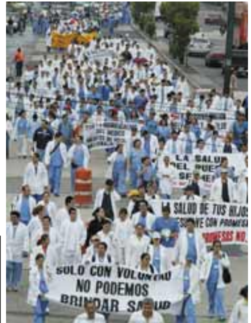
Manifestación de Médicos en Huelga.- Guatemala

Nicaragua: ¡NACIONALIZACIÓN BAJO CONTROL OBRERO DEL SISTEMA ENERGÉTICO!!