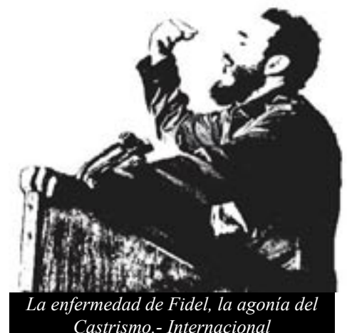
La enfermedad de Fidel, la agonía del Castrismo.- Internacional