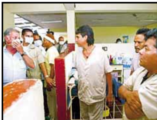
Oscar Berger, constata el estado deplorable del Hospital San Juan de Dios

Esta etapa finalizó el 26 de junio con la firma de un acuerdo para poder fin a la huelga y restablecer las consultas externas. El gobierno se comprometió a enviar al congreso un decreto de excepción a la ley de contrataciones que le permita gastar rápidamente Q86.8 millones en suministros a los hospitales; incluir en