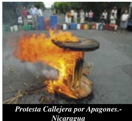
Protesta Callejera por Apagones.- Nicaragua

Costa Rica: Por un paro General organizado desde las bases.