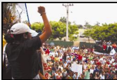
Concentración frente a INE que acabó invadiendo el edificio.

la desmovilización de los barrios, ante el temor de ser utilizados por el sandinismo y el FNT, quienes poseen un rosario de traiciones al pueblo trabajador. El FSLN en su afán de “captar” espacio y cámaras, más bien marcó el final de las protestas populares, ya que los métodos de las “turbas sandinistas” no suman a la población. El punto culminante del operativo sandinista fue “el asalto” al edificio de INE, en donde organismos ligados al FSLN provocaron a los agentes de seguridad hasta invadir y dañar el lugar.