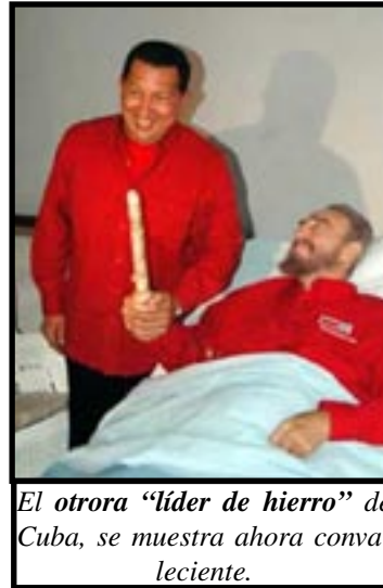
El otrora “líder de hierro” de Cuba, se muestra ahora convaleciente.

Y aquí es donde, al borde de la muerte, se cierra el ciclo de la evolución política de Fidel Castro. Si comparamos todas las fases de la revolución francesa, y de la revolución rusa, podemos decir, sin temor a equivocarnos, que Fidel Castro representó el inicio de la revolución, su etapa heroica, el tránsito hacia el socialismo, convertirse en socio