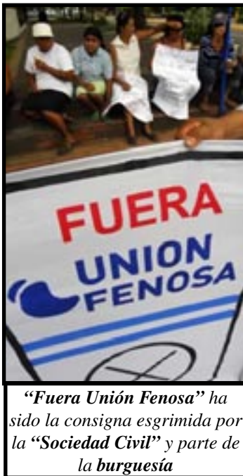
“Fuera Unión Fenosa” ha sido la consigna esgrimida por la “Sociedad Civil” y parte de la burguesía

Durante más de 8 semanas, el país se ha sumido en el caos ocasionado por la más reciente crisis energética, que ha implicado cortes hasta de 12 horas en todo el país. Esta situación empujó a muchos pobladores de las localidades más humildes a protestas en las calles.