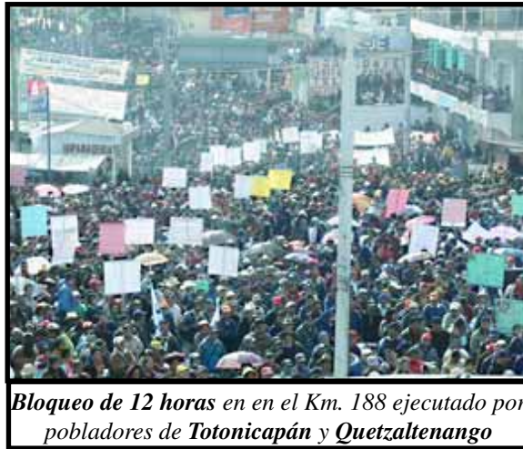
Bloqueo de 12 horas en el Km. 188 ejecutado por pobladores de Tonicapán y Quetzaltenango

Los médicos han tenido una actitud de lucha firme, ineludible y consecuente con el gobierno. Esta es una enseñanza valiosa en la actual coyuntura, cuando ante la ola de movilizaciones y protestas que se han sucedido desde inicios del año, el gobierno ha tratado de desmovilizar