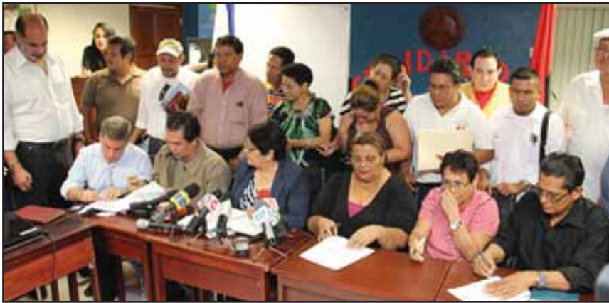
La Comisión Nacional del Salario Mínimo ratifica el mismo miserable aumento

Mientras los precios de la canasta básica continúan un inalcanzable ascenso, los mal llamados representantes de los trabajadores (Sindicatos Oficialistas) traicionan a sus