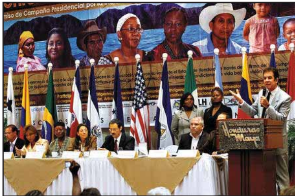
Candidatos Presidenciales firman Acuerdo

De la misma manera, la empresa Cid Gallup coloca a Xiomara Castro y Salvador Nasralla en la cabeza del proceso. “La mayoría de la población hondureña