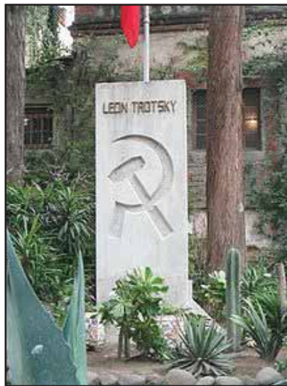
Tumba de León Trotsky en Coyoacán, México

Nos acordamos de los días en que habían dirigido la primera revolución triunfante de la clase obrera. Natalia se negaba a salir del cuarto, no comía, miraba con los ojos secos, las manos entrelazadas, con los nudillos blancos, mientras las horas pasaban una tras otra durante esa noche larga y terrible. Y el día siguiente, que fue interminable. Los informes de los médicos veían signos favorables, una mejoría ocasional y, hasta el final, sentimos que de alguna manera, este hombre que había sobrevivido a las cárceles del zar, los exilios, tres revoluciones, los juicios de Moscú, sobreviviría este golpe traicionero sin nombre que le había dado Stalin. Pero el Viejo tenía más de sesenta años. Había estado mal de salud durante unos meses. A las 19:25 del 21 de agosto, entró en la crisis final. Los doctores trabajaron durante veinte minutos, utilizando todos los métodos científicos que tenían a su disposición. Pero ni la adrenalina podía revivir el gran corazón y la gran mente que Stalin había destruido con un pico-hacha. ■