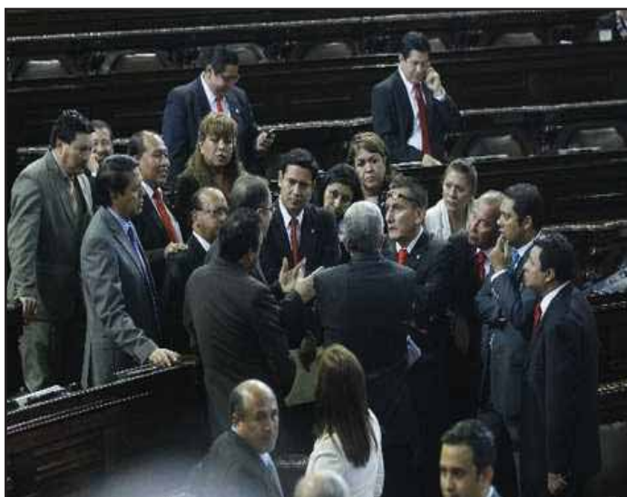
Diputados discuten sobre aprobación de bonos

El desempeño del Congreso este año pone al desnudo lo peor de la política parlamentaria burguesa: demagogia, compra de voluntades, corrupción e intereses ocultos. Por ello el Partido Socialista Centroamericano (PSOCA) propone como alternativa la convocatoria a una Asamblea Nacional Constituyente que transforme el país a favor de las masas oprimidas y barra toda la basura parlamentaria. ■