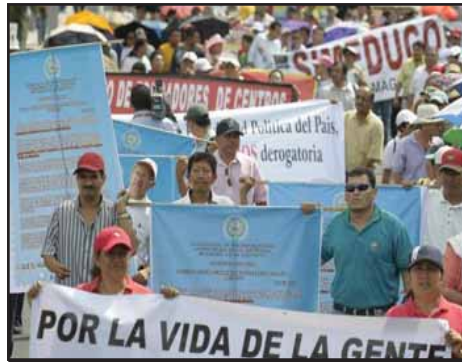
EL SALVADOR.- Los trabajadores públicos debemos luchar unidos