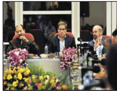
NICARAGUA.- La democracia de los empresarios