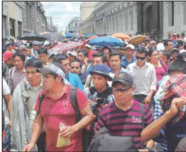
Marcha de la Coordinadora Magisterial en Resistencia

La prensa burguesa, con su sensacionalismo habitual, hace énfasis solamente en la aversión al STEG y la división en el magisterio, buscando en el fondo desprestigiar a los sindicatos. Lo que no menciona en relación a la CMR es su política de enfrentar al gobierno en los temas candentes de la educación: rechazo al Acuerdo 1505 2013, que impone la represión contra los estudiantes en los institutos públicos; su rechazo a la reforma de la carrera magisterial; su reclamos sobre las condiciones de contratación de los maestros.