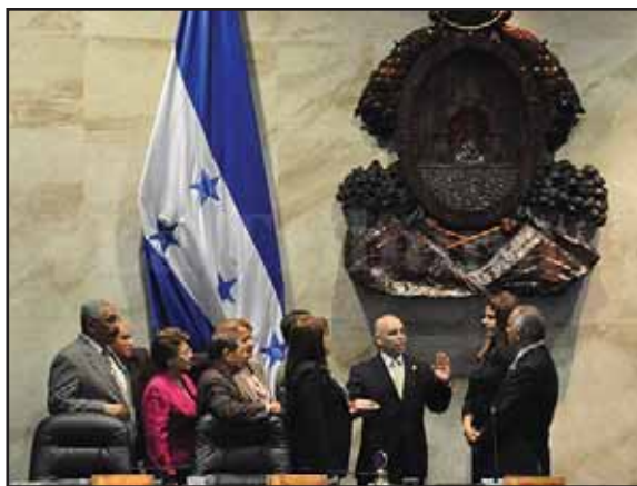
Juramentación del nuevo Fiscal y su Adjunto