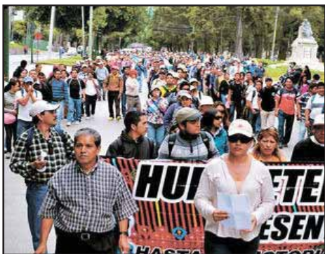
GUATEMALA.- Hacia una radicalización de las organizaciones magisteriales

GUATEMALA.- Ineficacia de la CICIG en lucha contra impunidad