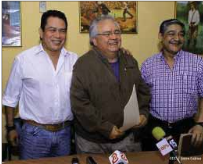
Dirigentes sindicales sandinistas

Estas afirmaciones son una excusa absurda, un dinero que fue cotizado por estas personas durante muchos años no puede venir a quebrar al INSS, ese dinero debe de mantenerse, a menos que existan malos manejos dentro de la Institución y que dicha plata haya sido ocupada para otros propósitos, lo que significaría que el INSS no cumple con su función, y se debería de procesar y sancionar a los culpables de esa malversación.