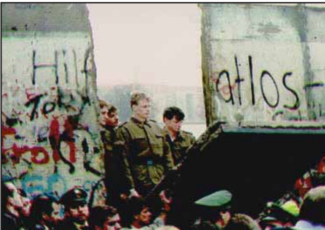
Caída del Muro de Berlín en 1989

Tras la derrota nazi y como parte de los compromisos de los aliados, Alemania