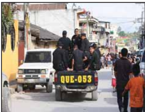
GUATEMALA.- Santa Cruz Barillas se opone a la Hidroeléctrica