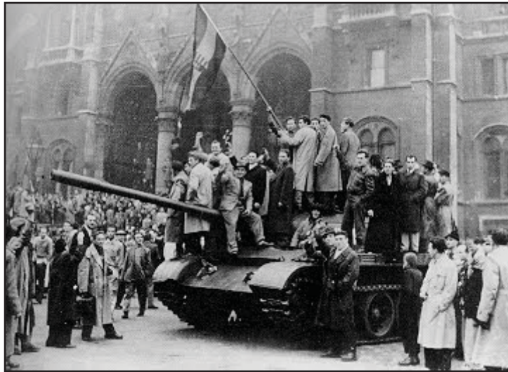
Insurrección Obrera en Hungría, 1956

En el plano económico, se aplicó un modelo productivo basándose en planes quinquenales -sin duda un logro sustancial con respecto