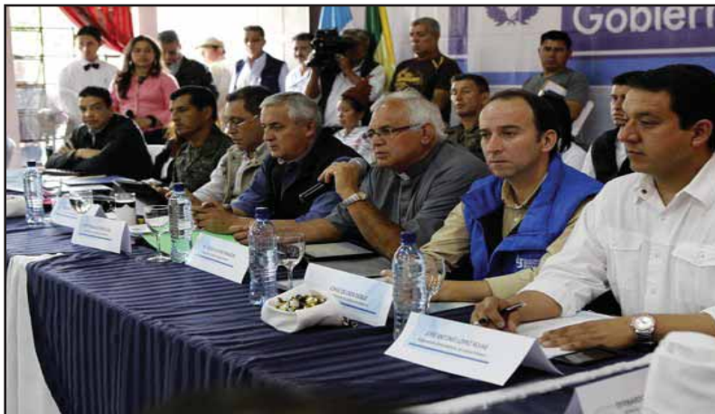
Diálogo en Santa Cruz Barillas