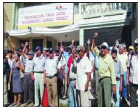
NICARAGUA.- La verdad sobre las reformas a la Seguridad Social