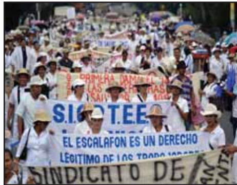
EL SALVADOR.- Huelga y luchas de trabajadores de la Salud