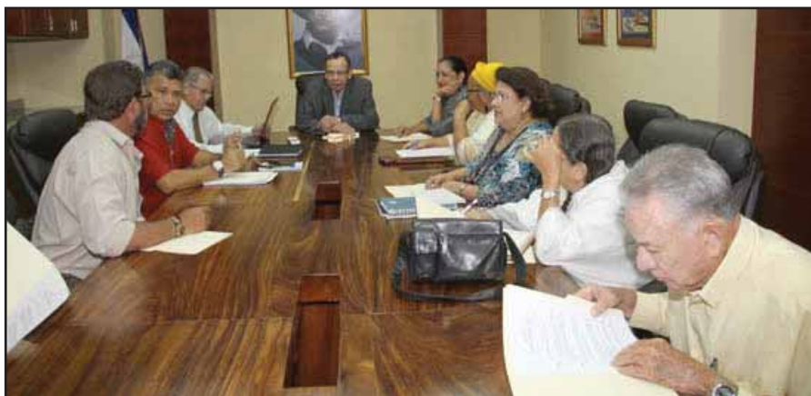
La Junta Directiva de la Asamblea Nacional ordenó la creación de una Comisión Especial

Indudablemente el aspecto crucial de la reforma constitucional es la derogación de las inhibiciones al presidente de la República. Daniel