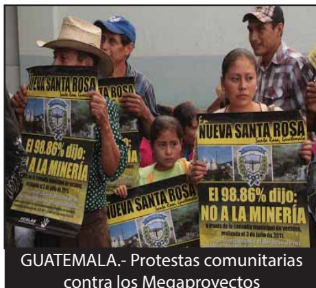
GUATEMALA.- Protestas comunitarias contra los Megaproyectos

NICARAGUA.- Reformas Constitucionales e institucionalización del régimen Bonapartista