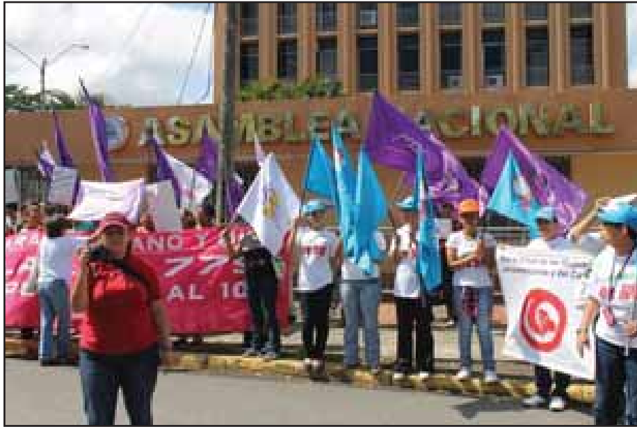
La sociedad civil se opone a las reformas

Esta propuesta obliga a los trabajadores y sus organizaciones a participar en diálogos con los empresarios, bajo la tutela del Estado: