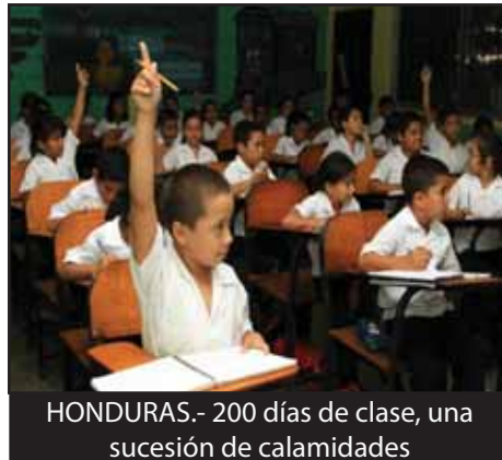
HONDURAS.- 200 días de clase, una sucesión de calamidades