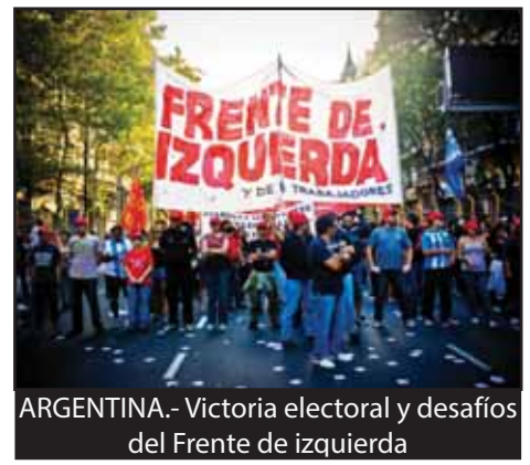
ARGENTINA.- Victoria electoral y desafíos del Frente de izquierda