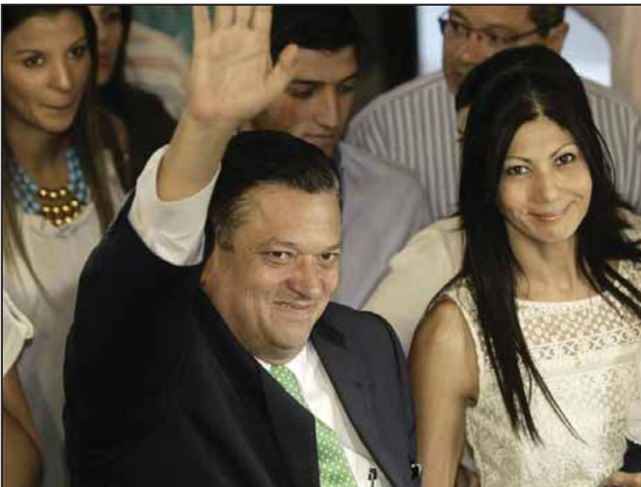
Johnny Araya se despide y renuncia. La crisis del PLN está al rojo vivo

la segunda ronda de votación se presenta muy difícil y llena de obstáculos (...) Los recursos y el tiempo son tan limitados como inmensa es la tarea de revertir la tendencia contraria. Por razones éticas, es inaceptable el recurso a tácticas innobles en el afán de variar las percepciones políticas (...). La prudencia aconseja no gastar millones de colones en propaganda, reuniones y movilizaciones. Acatamos las normas constitucionales