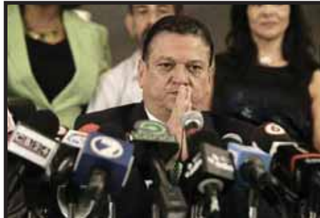
COSTA RICA.- La renuncia de Johnny Araya