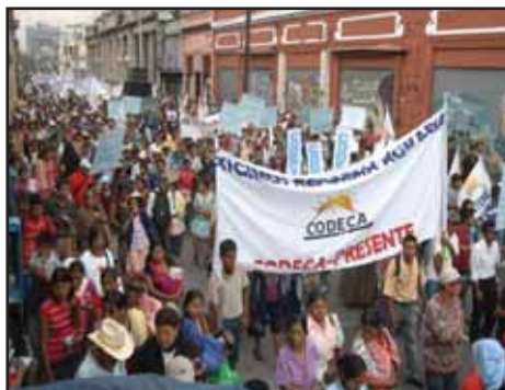
GUATEMALA.- Campesinos de CODECA marchan en la capital

PANAMA.- Ruptura de relaciones diplomáticas, Resolución de la OEA y pleito por deuda multimillonaria