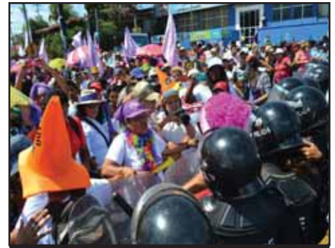
NICARAGUA.- Reprimen marcha de Mujeres el 8 de Marzo