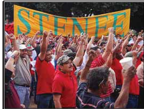
HONDURAS.- STENEE debe encabezar lucha contra privatizaciones