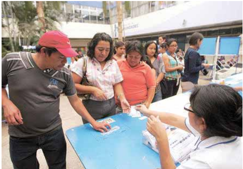
Votaciones para elección de rector en la Usac

Las voces de protesta contra este injusto sistema electoral no faltaron. En especial la Asociación de Estudiantes de