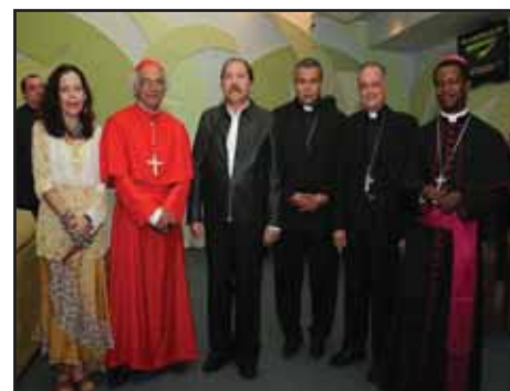
NICARAGUA.- La reconciliación del FSLN con la Iglesia Católica