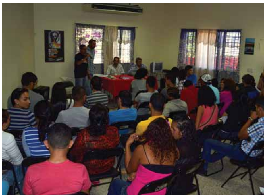
Parte de la asistencia a la conmemoración