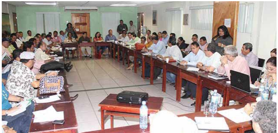
Reuniones de discusión al respecto del salario mínimo.