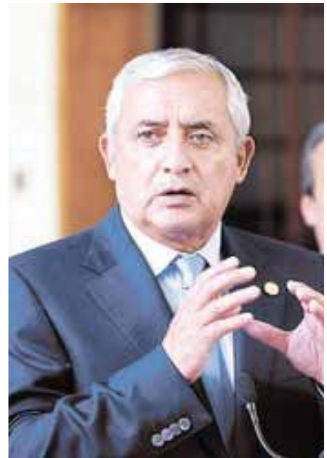
El presidente Pérez Molina da declaraciones sobre el caso Taiwán

La sociedad ha sido también en los últimos años encubridora de este revanchismo movilizad por la gran oligarquía. La parafernalia mediática silenció a un hombre –Portillo– e hizo del pueblo un partícipe activo de este castigo impuesto por la burguesía nacional al único caudillo populista con un proyecto de transformación política. Portillo, es un viejo cuadro de la base urbana del EGP (Ejército Guatemalteco de los Pobres) cuyo oportunismo lo llevó a pasar a la moderación de la izquierda reformista legal del PSD (Partido Social Democrático) y después a la reserva de la derecha de la DCG (Democracia Cristiana de Guatemala), pero aún más contradictorio, pasar a las filas del FRG, cuyas doctrinas combatía en sus remotos tiempos de guerrillero de pasillo. Cómo