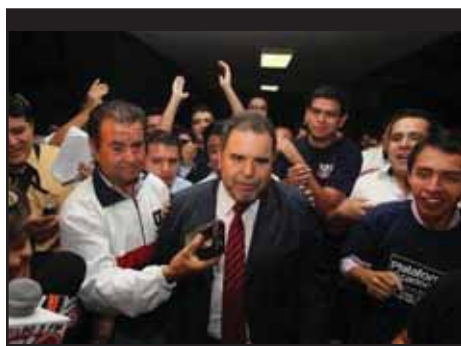
GUATEMALA.- Oficialismo se impone en elecciones antidemocráticas en USAC