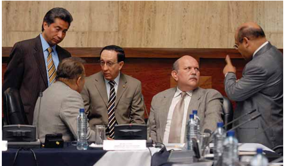
Miembros de la comisión de postulación a fiscal general