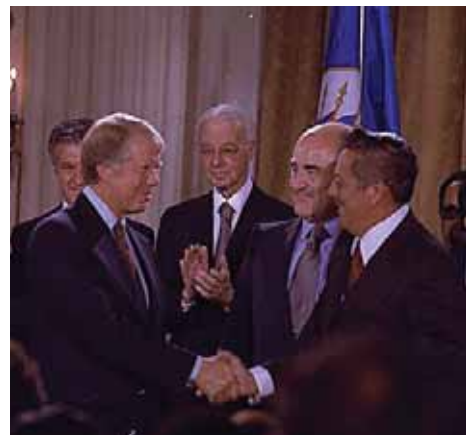
Jimmy Carter con Omar Torrijos