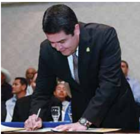
Juan Orlando durante la firma de Firma de los "pactos unilaterales"

La política económica del gobierno de Juan Orlando Hernández se diferencia de la de su antecesor por la imperativa necesidad de la recaudación de tributos para amortiguar el pago de la deuda interna, misma que se disparó durante el gobierno de Porfirio Lobo. Para poder hacerle frente al pago de la deuda interna se debe de reducir el déficit fiscal, es decir, aumentar las recaudaciones y reducir el gasto público. En ese sentido, el gobierno anterior en los últimos días de su gestión aprobó de forma maratónica la ley de