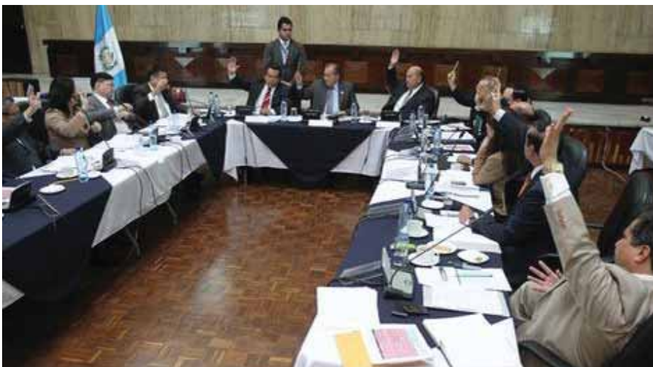
La comisión postuladora de fiscal general

La conformación de la Comisión de Postulación, que se dio casi al mismo momento que la CC resolvió acortar el mandato de la fiscal general (situación relacionada a la forma en que fue nombrada para ese cargo en el gobierno de Álvaro Colom al remplazar a Conrado Reyes tras su breve periodo en funciones)