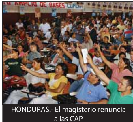
HONDURAS.- El magisterio renuncia a las CAP