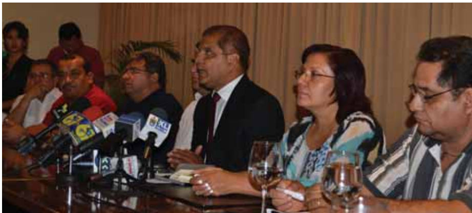
Oscar Ortiz, vice presidente electo, dando las declaraciones de la reunión con representantes de las organizaciones sindicales

propuesta de las cosas que debe hacer el gobierno próximo, entre estos: Generar más y mejores empleos, abordar temas de seguridad y el empleo, continuar con un diálogo permanente con las diferentes organizaciones sindicales, aumentar la base fiscal a través de impuestos y políticas fiscales, además de creación y observación de leyes, entre éstas la de la Función Pública, el Acuerdo de Asociación con la Unión Europea y los Asocios Públicos Privados. Además el vice presidente electo mencionó que era necesario seleccionar solamente dos o tres personas de todas las organizaciones para continuar los diálogos.