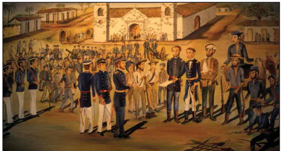
Oleo sobre la rendición de William Walker en San Juan del Sur, Nicaragua, bajo el asedio de los ejércitos centroamericanos

La primera incursión que realiza Walker y sus filibusteros se da en la ciudad de Rivas. Luego hace una incursión sorpresa en Granada y logra tomar la ciudad, que en ese momento era la capital conservadora de Nicaragua. Al tomar la ciudad acuerda con los caudillos conservadores que Patricio Rivas fuese presidente de Nicaragua. Walker se autoproclama jefe del ejército y Ponciano Corral ocuparía el cargo de Ministro de Guerra. Meses después, Corral sería fusilado por enviar una carta a los generales hondureños Pedro Xatruch y José Santos Guardiola en las que solicitaba su intervención en el conflicto.