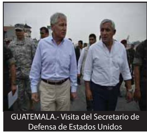
GUATEMALA.- Visita del Secretario de Defensa de Estados Unidos