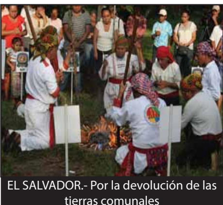
EL SALVADOR.- Por la devolución de las tierras comunales