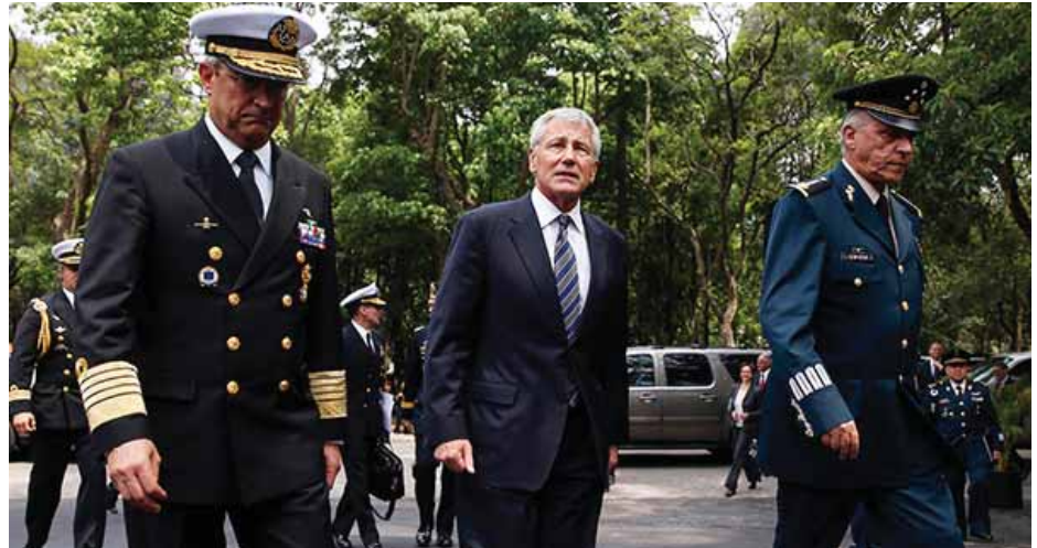
El secretario de defensa Chuck Hagel llega a Guatemala

Como Chuck Hagel no dio declaraciones, fue Pérez Molina quien comunicó a los medios los temas de que se habló en la reunión. Según Hagel los Estados Unidos están dispuestos a continuar apoyando en temas de seguridad, en especial en la lucha contra el crimen internacional uniendo esfuerzos con Guatemala y México. Manifestó que para este año hay más de US$ 40 millones disponibles para el Sica. El presidente guatemalteco declaró que Estados Unidos cooperará en la creación de fuerzas de tarea en las fronteras con Honduras y El Salvador, y posiblemente una en Petén, cubriendo las rutas utilizadas por el narcotráfico. Según Pérez Molina, el gobierno guatemalteco invitó a Estados Unidos durante la reunión, a que se una a las acciones conjuntas realizadas por México y Guatemala en las áreas fronterizas donde opera el crimen organizado, propuesta que será analizada por Washington (información de Siglo XXI 25/04/14). Además se habló sobre la cooperación militar y de inteligencia