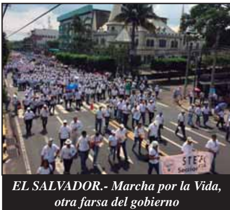
EL SALVADOR.- Marcha por la Vida, otra farsa del gobierno