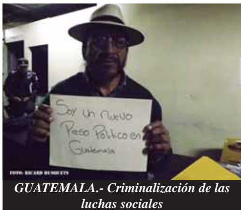
GUATEMALA.- Criminalización de las luchas sociales

1 DE ABRIL DE 1970: A 45 AÑOS DE LA FUNDACIÓN DE LAS FPL "FARABUNDO MARTÍ"