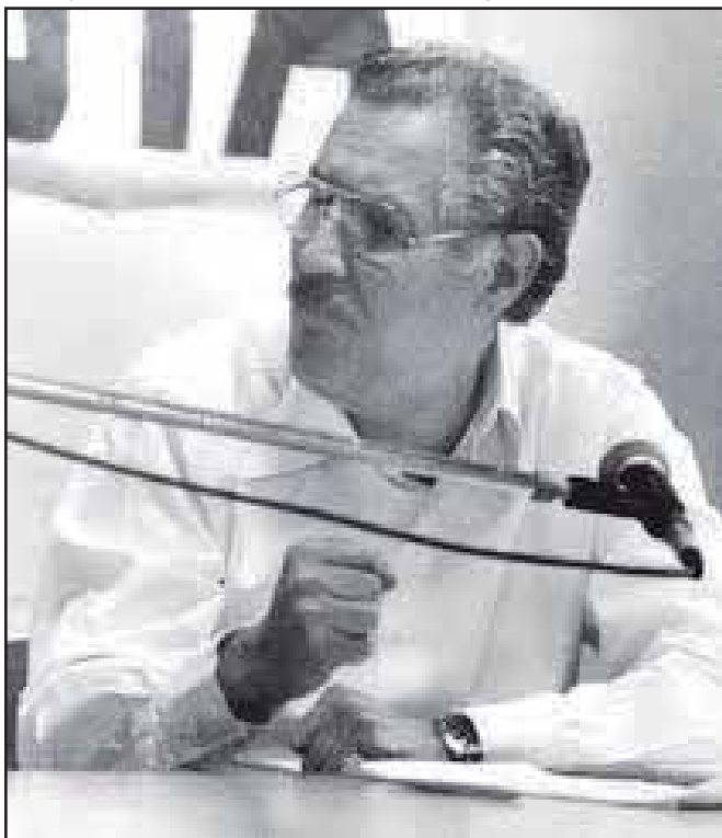
NAHUEL MORENO 1924-1987

A medida que ascendemos en el partido y vamos hacia los organismos de dirección el centralismo democrático se aplica en forma diferente. El centralismo y la disciplina es cada vez más grande,