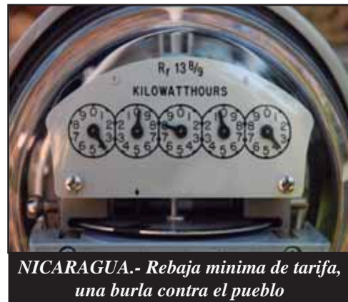
NICARAGUA.- Rebaja mínima de tarifa, una burla contra el pueblo