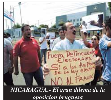
NICARAGUA.- El gran dilema de la oposición bruguesa