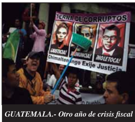
GUATEMALA.- Otro año de crisis fiscal

20 DE AGOSTO DE 1968: LA URSS INVADE CHECOSLOVAQUIA.