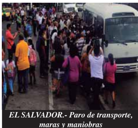
EL SALVADOR.- Paro de transporte, maras y maniobras