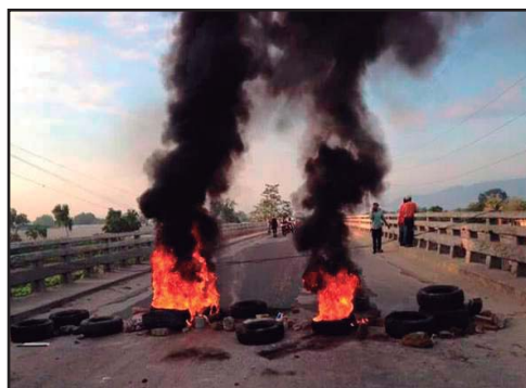
HONDURAS.- Discutamos un balance de los "paros cívicos" del 2015