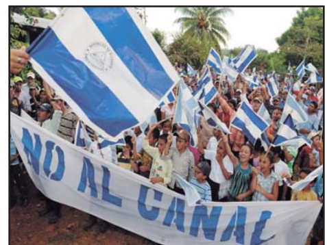
NICARAGUA.- Descontento campesino por la construcción del Canal