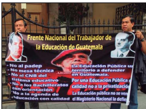
GUATEMALA.- Defender los pactos colectivos en el Estado