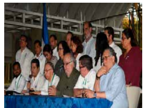
NICARAGUA.- Crisis e impasse del Diálogo Nacional