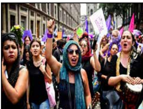
CENTROAMÉRICA.- 8 de Marzo confiscado por feminismo burgués