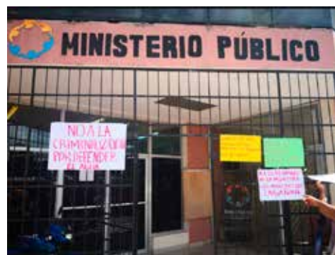
HONDURAS.- Continúa criminalización de los movimientos sociales