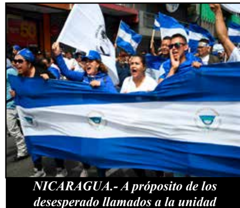
NICARAGUA.- A propósito de los desesperado llamados a la unidad