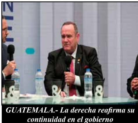
GUATEMALA.- La derecha reafirma su continuidad en el gobierno