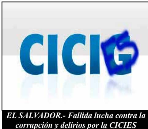
EL SALVADOR.- Fallida lucha contra la corrupción y delirios por la CICIES