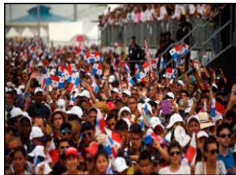
PANAMÁ.- ¡Abajo las reformas constitucionales!