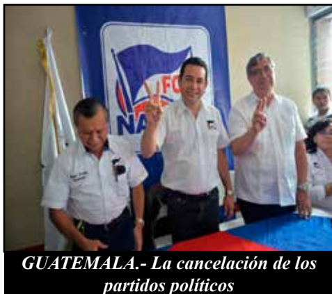
GUATEMALA.- La cancelación de los partidos políticos