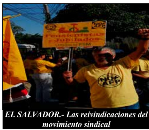
EL SALVADOR.- Las reivindicaciones del movimiento sindical