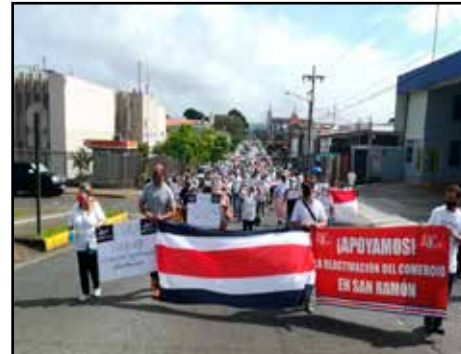
COSTA RICA.- Seis propuestas para enfrentar la crisis sanitaria y económica