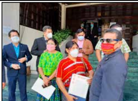
GUATEMALA.- Política Independiente en torno al conflicto por la CC

GUATEMALA.- EL DESPLOME DEL SISTEMA DE SALUD APLASTA A SUS TRABAJADORES