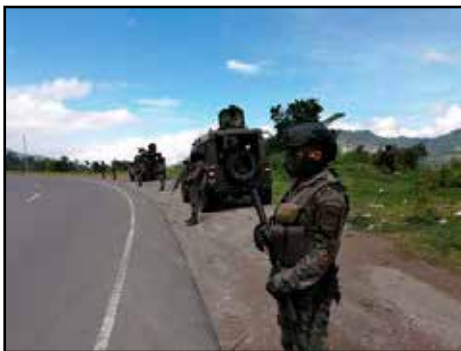
GUATEMALA.- El Estado al servicio de la depredación de los recursos naturales

HONDURAS.- ETERNOS ESCÁNDALOS DE CORRUPCIÓN