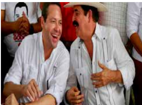
HONDURAS.- Resurgen corrientes claramente liberales dentro de LIBRE