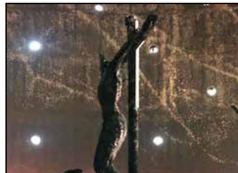
NICARAGUA.- La agudización de la crisis y los ataques a la Iglesia Católica