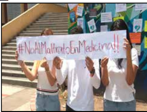
EL SALVADOR.- Por la defensa de la UES y de la educación pública