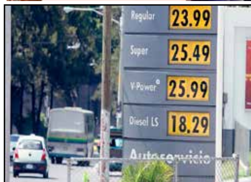
GUATEMALA.- Grave escalada inflacionaria.-