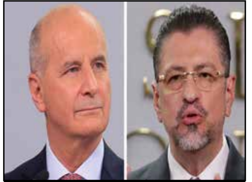
COSTA RICA.- La decadencia de la democracia electoral