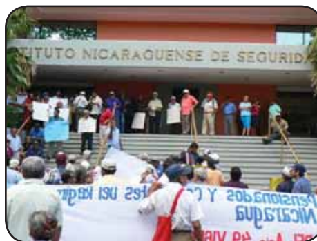
NICARAGUA.- Crisis y bancarrota de la Seguridad Social.