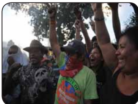
GUATEMALA.- Protestas evidencian crisis del sistema electoral.

!! IMPUSEMOS CANDIDATURAS INDEPENDIENTES!! MANTENGAMOS AL ENRP COMO UN FRENTE DE LUCHA