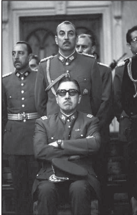
Pinochet a la cabeza de la Junta Militar en 1973

Ante la convulsión de esa época, la clase obrera constituye un sector importante que pudo haber evitado el golpe, los cordones obreros fueron organismos de poder dual que se organizaron, lucharon y advirtieron contra el golpe