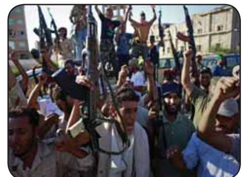
LIBIA.- Fin de la guerra civil y peligros que acechan a la revolución.