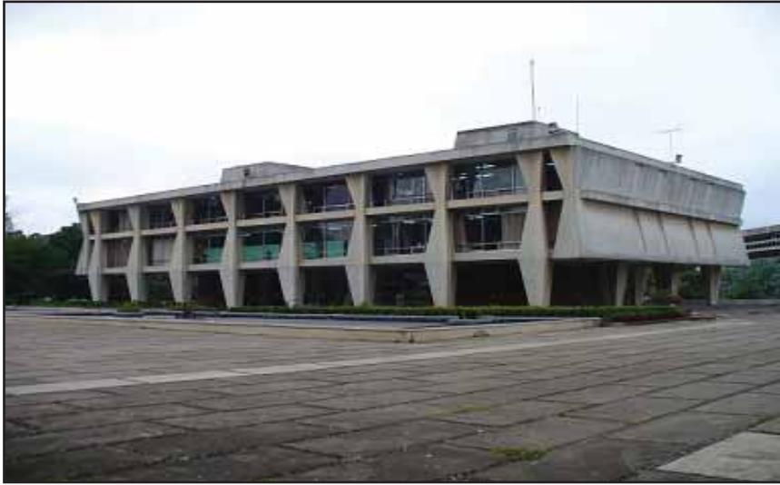
Edificio de Rectoría de la USAC

Tanto los vocales I como II, que son docentes y el primero además ejerce la función de decano su ausencia, tenían que ser electos tanto por docentes como por estudiantes, pero este fallo vino a cambiar la situación. Por lo tanto el colectivo EPA se movilizó y tomó por 54 días el campus central junto a otros campus de la USAC en el país. A raíz de esto se creó un acuerdo con el CSU para hacer dos mesas de trabajo, uno que restituya los derechos estudiantiles perdidos tras el fallo de la CC y otro que elabore los lineamientos