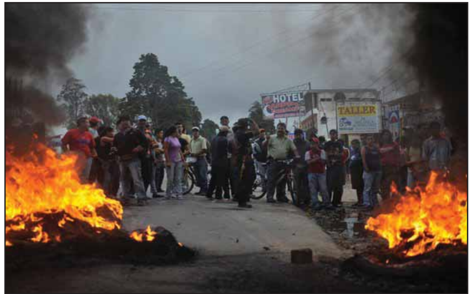
Vecinos de El Tejar protestan por resultados electorales

Los partidos UNE-GANA, Patriota y Líder fueron los que más violentaron la ley electoral, invirtiendo en su campaña mucho más de los Q 48 millones permitidos