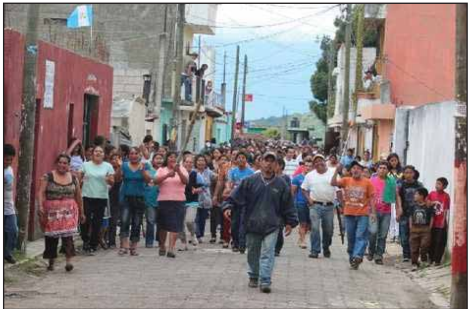
Vecinos piden repetir elecciones a alcalde en Santa Lucía Milpas Altas

El Partido Socialista Centroamericano (PSOCA) llamó en la primera vuelta al voto crítico por el Frente Amplio porque no representa los intereses de ninguna burguesía y por su programa democrático. Pero tanto Pérez Molina como Baldizón representan al enemigo de clase. Con variantes, con diferencias. El candidato del PP tiene un pasado militar y represor; Baldizón encarna el enriquecimiento mediante la corrupción y el crimen organizado. Además recordemos que cuando fue