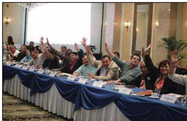
El Consejo Económico y Social (CES) respaldó el proyecto de Ley

de ejemplo si el despedido ganaba quinientos dólares despedirá doscientos cincuenta trabajadores públicos pero con esos despidos contraria a quinientos trabajadores nuevos porque ya no pagara quinientos dólares por un trabajador sino