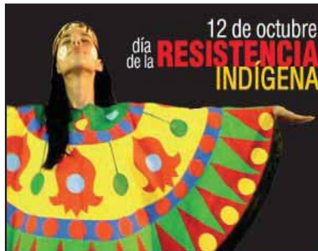
EL SALVADOR.- 12 de Octubre, día de la Resistencia Indígena