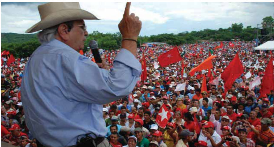
Fabio Gadea Mantilla en la apertura de campaña

régimen político que se ha transformado en un régimen cada vez más bonapartista bajo la segunda presidencia de Daniel Ortega.