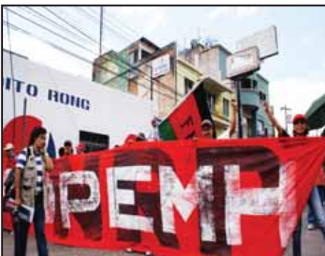
HONDURAS.- Terminar con las argollas y dictaduras dentro del magisterio

!! GUATEMALA: VOTE NULO EN LA SEGUNDA VUELTA !!