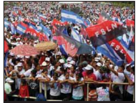
NICARAGUA.- ¿Daniel Ortega "for ever"?