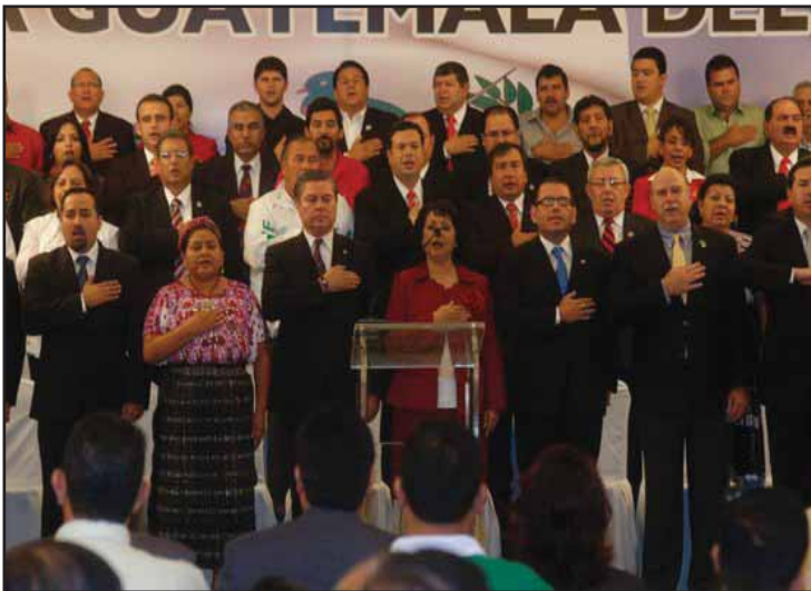
Baldizón y sus aliados