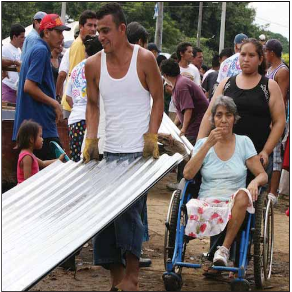
Pobladores de Managua recibiendo láminas de zinc

Por ello proponemos una estrategia de crecimiento que aumente lo más posible el número de empleos al alcance de los trabajadores no calificados (la gran