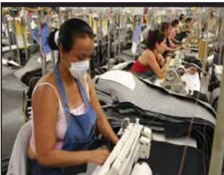
GUATEMALA.- Empresarios no cumplen con el salario mínimo.

NICARAGUA: UNIÓN EUROPEA Y ESTADOS UNIDOS, A REGAÑADIENTES, RECONOCEN ELECCIONES