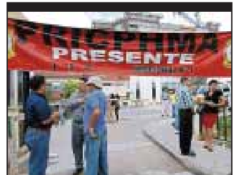
HONDURAS.- Lobo-Hernández dispuestos a desarticular al magisterio