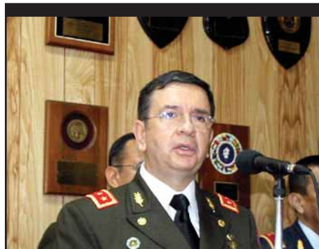
EL SALVADOR.- Funes se inclina por el militarismo.