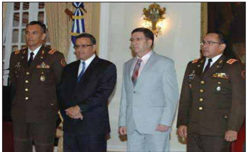
Funes, el ahora ministro Payes, y la cúpula militar

focalizados en las zonas del país con más altos índices delincuenciales, lo cual son medidas que ya se han impulsado en países de la región centroamericana. Es de recordar que estos estados de sitios son los mismos que se implementaron en el conflicto, en los cuales se suspenden legalmente muchos derechos garantizados por la misma constitución burguesa.