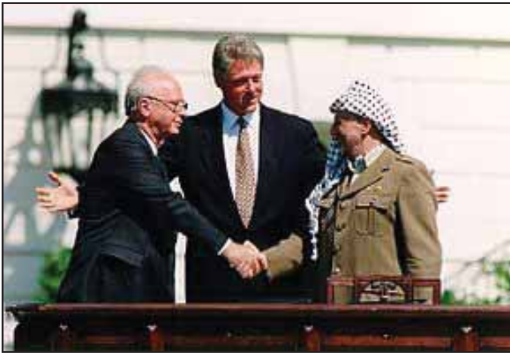
Arafat firmó los Acuerdos de Camp David, pero el Estado Palestino todavía no se ha formado

Los Estados opresores siembran las semillas para su destrucción, ese es el caso del Estado sionista de Israel que lleva más de medio siglo oprimiendo, explotando y masacrando al pueblo palestino. Pero toda la historia de colonialismo del Estado sionista fue creando un fenómeno de descontento y lucha heroica en el pueblo Palestino, que hasta el día de hoy sigue batallando por su liberación de la opresión de los