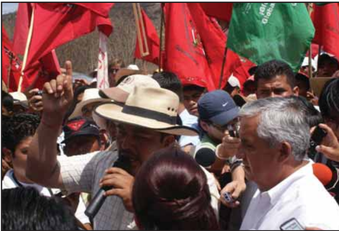
Pérez Molina se encontró con los marchistas en la carretera

El Frente Norte del Área Metropolitana, Vía Campesina, el Comité de Unidad Campesina, la Coordinadora y Convergencia Nacional Maya y el Comité Campesino del Altiplano entre otras