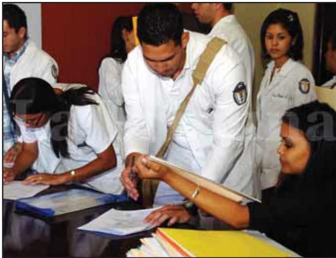
Médicos Internos firman un Acuerdo con la Secretaría de Salud

Pero el punto mas candente en la actualidad, en los hospitales y en todo Honduras, son los bajos salarios y el