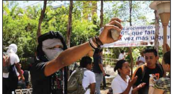
Estudiantes de la UPOLI

fondos, acusaciones que recaen sobre todos los dirigentes de UNEN. En estos enfrentamientos se volvieron a observar los actos de vandalismo y métodos de pandilleros que caracterizan a UNEN, saliendo a relucir morteros, cuchillos, piedras y hasta armas de fuego, resultando heridos siete estudiantes y un dirigente sindical.