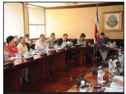
COSTA RICA. Sindicatos retroceden y el gobierno avanza