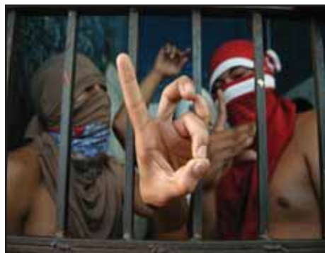
EL SALVADOR.- Reflexiones sobre el Acuerdo del Gobierno con las Maras