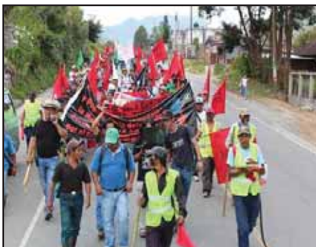
GUATEMALA.- Pérez Molina intenta seducir a la Gran Marcha Campesina

Imperialismo y reconfiguración del Mapa Mundial