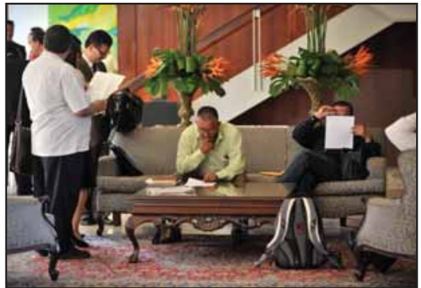
Dirigentes sindicales revisan los Acuerdos

Fiscal, el proyecto de Ley de Empleo Público es el principal ataque contra los trabajadores. Actualmente existen 3 proyectos de ley en la Asamblea Legislativa (15290, 17623 y 17628), que persiguen disminuir o eliminar las conquistas laborales, la más peligrosa es la Ley de Empleo Público que pretende eliminar los pluses salariales, estableciendo categorías salariales únicas, donde no habrían incentivos o sobresueldos, reducción de aguinaldos, reducción de vacaciones en el sector magisterial, elimina pago de horas extras, prohíbe el salario en especie, flexibiliza los traslados, etc.