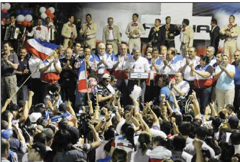
La plana mayor de ARENA, eufórica, proclamó su victoria

Entre las diferentes deficiencias formales estuvieron: la apertura tardía de los centros de votación, falta de transporte a los votantes, la movilidad o traslado de votantes de un centro de votación a otro diferente del que tuvo asignado en las votaciones anteriores, la no depuración de los fallecidos en el padrón electoral y la movilidad de