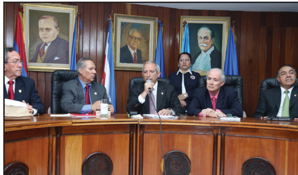
Sigfrido Reyes, presidente saliente de la Asamblea Legislativa de El Salvador, presenta la demanda ante la Corte Centroamericana de Justicia, con sede en Managua, Nicaragua

En este contexto la Sala de lo Constitucional de la Corte Suprema de Justicia contra atacó declarando inconstitucional las elecciones por parte de la Asamblea Legislativa de los magistrados en 2012 y va más allá