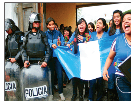
GUATEMALA.- Lucha de estudiantes Normalistas entra en nueva fase

PANAMÁ: Derrumbe de la Sala V, pero siguen las amenazantes privatizaciones