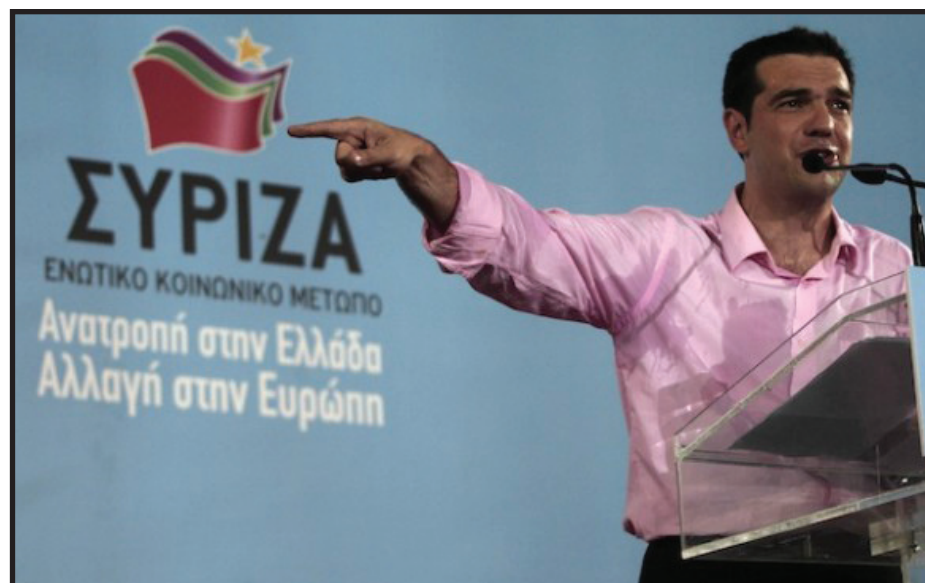
Alexis Tsipras, líder de Syriza

Es importante crear una coordinadora de defensa de la educación pública formado por las organizaciones sindicales, populares y universitarias, que active un plan de respaldo ante las acciones intimidatorias del gobierno, pero que también busque la permanencia para hacer frente ante los planes privatizadores de la burguesía en contra de la educación pública en general. ■