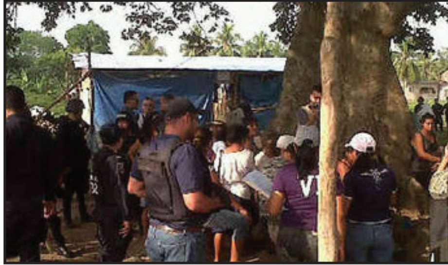
Desalojo de campesinos en San Manuel