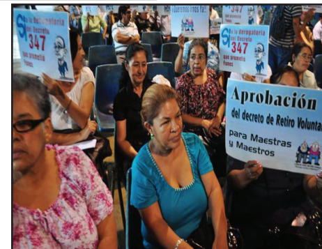
EL SALVADOR.- Maestros continúan desafiando a las autoridades