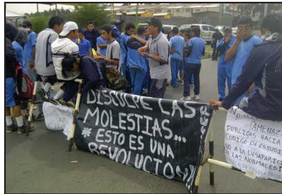
Instituto Normal Centroamérica y el Instituto Normal Para Señoritas Belén.

El gobierno amenazó con que le cancelaría la matrícula a los 9 dirigentes estudiantiles que firmaron el acuerdo del 12, dando plazo hasta el miércoles 20 de junio para que entregaran los edificios de los institutos, además de la