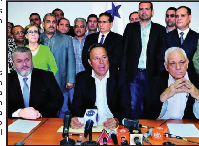
La oposición burguesa se montó sobre la movilización popular para derogar la Sala V

La ofensiva de Martinelli provocó la división en el gobierno. El vicepresidente Juan Carlos Varela, dirigente del Partido