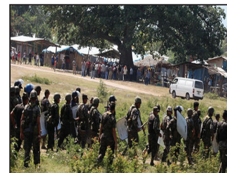
HONDURAS.- Alto a la feroz represión contra los campesinos en lucha