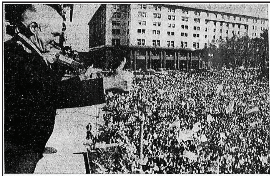
El general Galtieri saluda desde el Balcón de la Casa Rosada, 2 de abril de 1982

Argentina con una dictadura al borde del abismo: "se trató de una aventura de la dictadura para escapar a un impasse político derivado de una crisis económica sin precedentes (quiebra de bancos y empresas, desocupación récord, inflación, alta deuda externa, etc.). La fractura del gobierno militar se manifestó en el golpe contra Viola y el ascenso de Galtieri, en medio de una recuperación de las luchas obreras." ( http://po.org.ar/debate-malvinas )