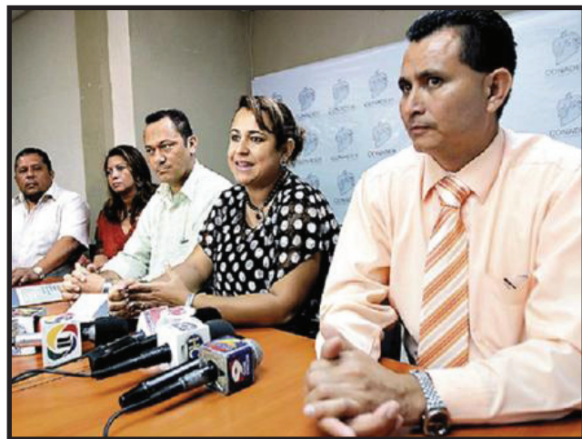
La Corte Suprema de Justicia amparó rápidamente a los directores despedidos