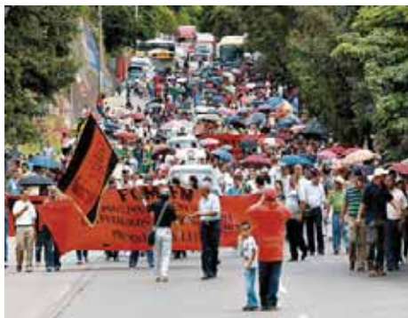
HONDURAS.- Frenemos el séptimo paquetazo fiscal con un Paro Cívico

CRISIS POLÍTICA E INTENSA LUCHA DE CÚPULAS POR CUOTAS DE PODER: