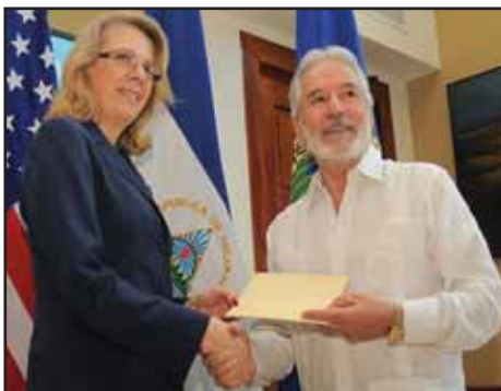
NICARAGUA.- "Waiver" y Genuflexión

EL SALVADOR: ¡LA SOLUCIÓN ES LA CONVOCATORIA A UNA ASAMBLEA NACIONAL CONSTITUYENTE!