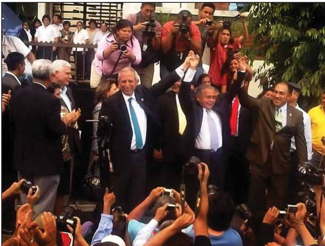
Sigfrido Reyes levanta la mano del magistrado Ovidio Bonilla, en una movilización de apoyo a la lucha por controlar la Corte Suprema de Justicia

Estos sectores emergentes de la burguesía ya controlan ciertos órganos del aparato del Estado burgués, lo que les permite presionar y negociar con quien más le conviene de cara a la defensa de sus intereses. Esta "toma" de una parte de las instituciones, preocupa a una parte del empresariado salvadoreño tradicional que considera que la democracia está en riesgo, aunque en realidad lo que está en riesgo son sus intereses económicos y políticos y la pérdida del control del aparato de Estado.