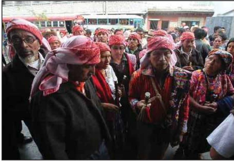
Representantes indígenas ingresan a la Corte de Constitucionalidad