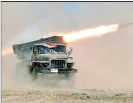
SIRIA.- Revolución, masacres y conspiraciones imperialistas