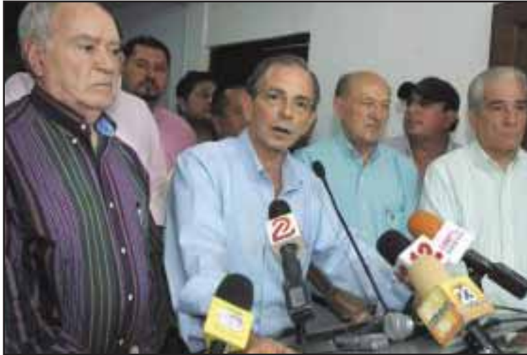
Tanto el PLC como el PLI se metieron de cabeza a las elecciones municipales

general. Una última encuesta nos indica cómo cree la población que se debe manejar la oposición: "debe organizarse para participar, dialogar y negociar con el gobierno y solo un 6.3% consideró que se debe organizar para enfrentarse y movilizarse en contra del gobierno." (Nuevo Diario, 16/07/2012).