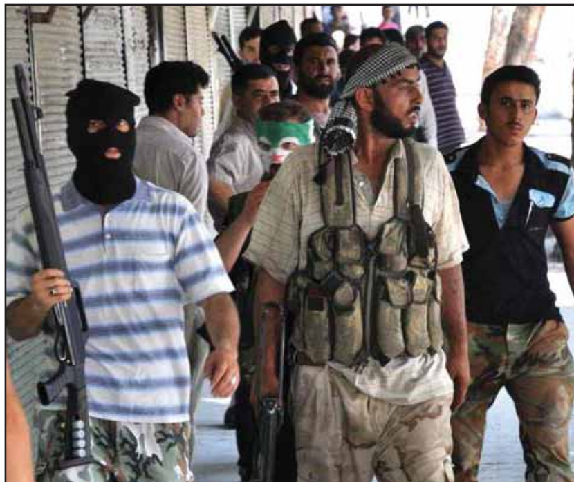
Milicianos mal armados se enfrentan al ejército sirio en Aleppo

La rebelión popular en Siria ha pasado por varios momentos. Las iniciales manifestaciones de protesta fueron brutalmente reprimidas, convirtiéndose rápidamente en insurrección y en una guerra de guerrillas, que se defiende con las uñas de las incesantes masacres y del genocidio, hasta convertirse en una abierta guerra civil, en una lucha a muerte por el poder político. El temor al triunfo de la insurrección popular, es decir, que se repita la experiencia de Libia, hizo que el imperialismo norteamericano y europeo, junto a las burguesías árabes, buscaran salidas negociadas a la guerra civil, aceptando incluso la sobrevivencia del régimen dictatorial, bajo el compromiso de