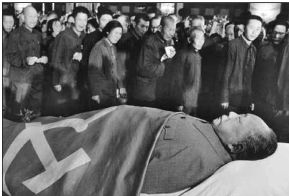
El cuerpo de Mao Tse Tung es velado en Pekín

La burguesía china que ya identifica sus intereses como contrarios a los obreros y campesinos, tomó el desprestigiado Komunitang (partido de gobierno) usando a su caudillo Chiang Kai Shek, que apoyado por