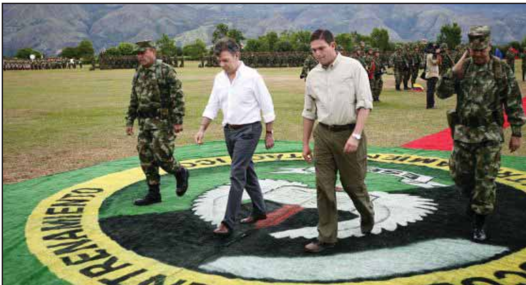
El Presidente Juan Manuel Santos y el ministro de defensa Pinzon