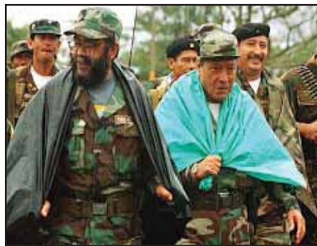
COLOMBIA: La derrota militar de las FARC y la negociación