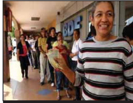
NICARAGUA: Aumento de salarios YA!!