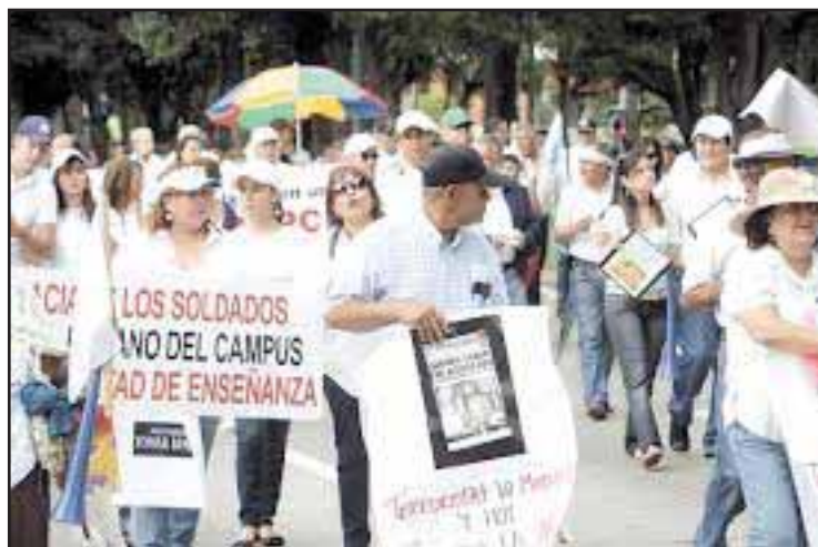
Familiares de militares presionan en las calles

políticos, y por ende en la posguerra se les considera un sector emergente de la burguesía nacional. El poder político evidentemente es necesario para que los distintos segmentos de la burguesía militar sigan manteniéndose a flote. Si miramos el caso del exgeneral Ríos Montt, tenemos un ejemplo concreto del caso: su poder político está en decadencia, está sindicado de genocidio. Cosa que no puede pasarle, por ahora, al presidente Otto Pérez Molina, acusado de crímenes de lesa humanidad contra la población Ixil. Por eso hay que pensar en la burguesía militar como cualquier otra burguesía tercermundista: con un oportunismo capaz de devorarse a sus hermanos más lerdos. ¿Será que el gobierno de este otro genocida saldrá al rescate de la dignidad militar? Probablemente no. ¿Quisiera