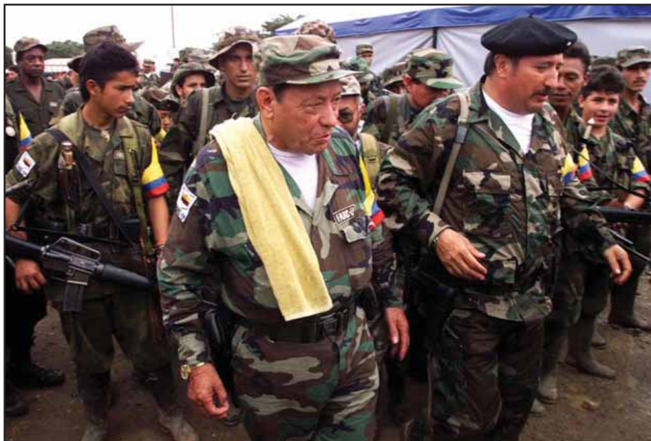
La dirigencia histórica de las FARC fue aniquilada

En 1958, preocupados por la situación de violencia, los Partidos Liberal y Conservador firmaron un pacto político, de alternancia en el gobierno, llamado Frente Nacional, que duró hasta 1974. Los diferentes gobiernos del Frente Nacional tuvieron como principal meta acabar con las "repúblicas independientes", refiriéndose a amplias zonas campesinas liberadas y bajo