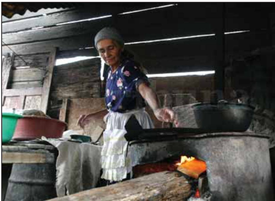
La pobreza aumenta día a día en Honduras

las variaciones económicas repercuten de forma directa en la lucha de clases. Una variedad de movimientos sociales se manifiestan como respuestas ante los planes de ajuste y de miseria que imponen las clases hegemónicas para equilibrar la profunda crisis que atraviesa el modo de producción capitalista.