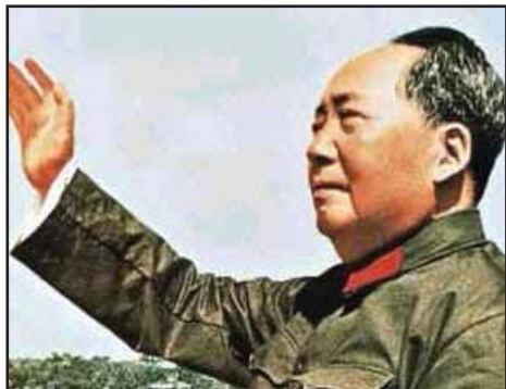
FECHAS: 9 de septiembre de 1976, fallece Mao Tse Tung

EL SALVADOR: GOBIERNO QUIERE QUE TRABAJADORES PAGUEN LA DEUDA