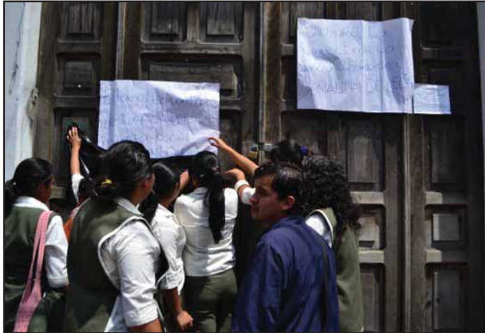
Toma del Instituto Belen

del gobierno no se han hecho esperar. El mismo día del anuncio oficial de la ministra un grupo de maestros y estudiantes realizaron una marcha de protesta contra la reforma. En esta marcha tuvo un papel protagónico el Sindicato Nacional de Trabajadores de la Educación. El sindicato denunció algunas políticas que el Ministerio implementará el próximo año y que afectarán los derechos laborales de los maestros, además de que manifestó su rechazo a la propuesta oficial de cambio en la carrera de magisterio. Estos compañeros docentes han manifestado su rechazo hacia el líder magisterial Joviel Acevedo y el equipo que dirige la Asociación Nacional del Magisterio desde hace cerca de diez años. Acevedo y su grupo participaron en la elaboración de la propuesta de Formación Inicial Docente y han tenido una actitud sumisa ante el actual gobierno pro-empresarial presidido por ex militares. En julio esta dirigencia oportunista fue rechazada por una asamblea de cerca de dos mil maestros de Zacapa y Chiquimula. Es de la mayor importancia que un gremio tan