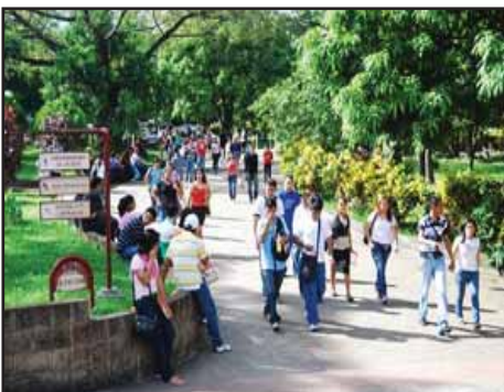
EL SALVADOR.- Amañado proceso de conformación de Asociaciones