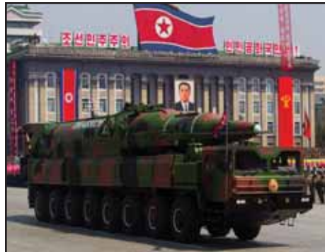
INTERNACIONAL.- Tensión en la península Coreana