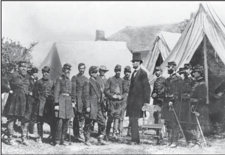
Abraham Lincoln al frente del ejército

La primera fue la revolución (1642-1689) que debilitó enormemente el absolutismo de los monarcas ingleses. La segunda fue la revolución de la independencia de las 13 colonias que conformaron los Estados Unidos (1776-1787). Y la tercera revolución fue la francesa (1789-1799). Estas dos