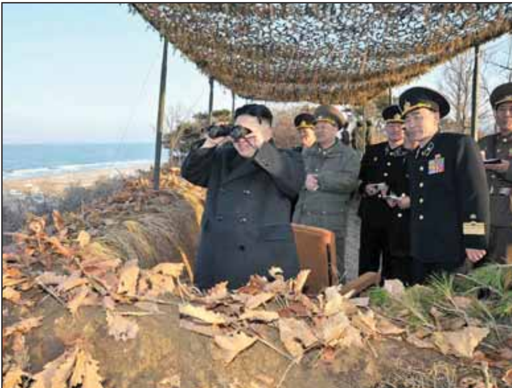
Kim Kyong-Hui inspecciona la frontera

El régimen norcoreano ante las agresiones gringas, utiliza una retórica bélica, realiza un movimiento de tropas y armas estratégicas nucleares situándolas en puntos con capacidad de alcanzar instalaciones militares surcoreanas, japoneses y estadounidenses en toda la región. EU por su parte refuerza sus capacidades militares en la zona,