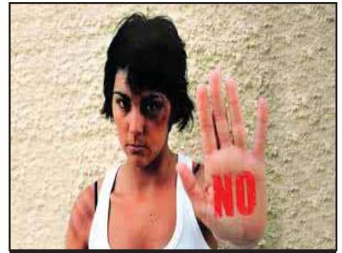
NICARAGUA.- A la caza de brujos Misógenos