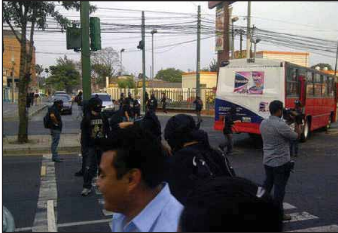
Bloqueo a favor del 5% para la USAC

con justeza que el CSU inicie un proceso de reforma, ven la participación en la marcha como un aval a la actuación de las autoridades, pero consideramos que esta postura lleva a aislarse y a desaprovechar una oportunidad para desenmascarar al CSU ante la opinión pública.