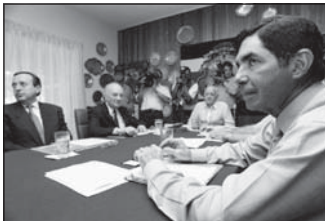
En primer plano, Oscar Arias y a la izquierda, Rafael Angel Calderón

Por tales razones, el Partido Revolucionario de los Trabajadores (PRT) llama a todas las organizaciones sindicales y populares de Costa Rica ha pronunciarse decididamente en contra de las propuestas de los ex-presidentes, y a procurar la más amplia unidad de acción en defensa del patrimonio nacional y los servicios públicos. Asimismo, llamamos a concretar una Asamblea Sindical y Popular con amplia participación democrática de todos los sectores, en el que se elabore y apruebe una propuesta de salida obrera y popular frente a la crisis. En ese marco, nosotros levantamos la moratoria de pagos de la deuda externa e interna como la medida inmediata que se debe imponer, sumada a la lucha por una profunda Reforma Tributaria, que desgrave el consumo popular y haga que los ricos paguen al fisco de acuerdo a sus altas ganancias. En ese sentido, se debe debatir de urgencia la propuesta de crear un impuesto progresivo al gran capital nacional y extranjero, así como la cárcel para los patrones evasores de impuestos y morosos con respecto a las cuotas de la seguridad social.