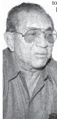
Ing. Roberto Cedeño