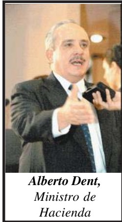
Alberto Dent, Ministro de Hacienda

La mayoría de estos cambios representan violentos ataques a las condiciones de vida y de trabajo para el movimiento obrero y de masas, ya que aumentan la carestía de la vida, reducen los salarios y ponen en riesgo el empleo de miles de trabajadores.