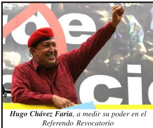
Hugo Chávez Faria, a medir su poder en el Referendo Revocatorio

Miles de trabajadores, estudiantes y activistas populares ven con confianza a Hugo Chávez, con un certero instinto las masas venezolanas reflexionan: “Chávez no nos ha dado muchas cosas, pero ha dado algo. Si los golpistas ganan las elecciones, podemos perder lo poco que hemos logrado”. Los marxistas, hemos estado “palmo a palmo” con las masas venezolanas en