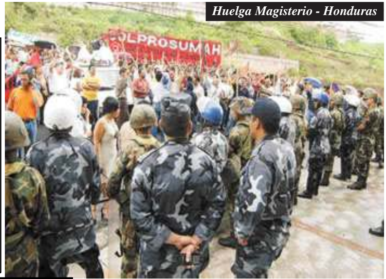
Huelga Magisterio - Honduras

Honduras: L. 5.00 - Nicaragua: c$ 5.00 - Costa Rica: ₡ 100.00