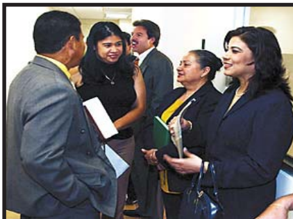
Juzgados dictan retención Migratoria, contra el ex rectora de la UNAH, y el actual Decano de Facultad de Ciencias jurídicas

Los estudiantes no son tomados en cuenta en la vida universitaria, las elecciones de autoridades estudiantiles se caracterizan por los fraudes permanentes y la total falta de propuestas para revertir la crisis