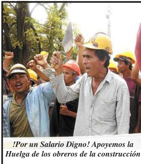
!Por un Salario Digno! Apoyemos la Huelga de los obreros de la construcción

Bajo el gobierno sandinista, el sector de la construcción se debilitó mucho. Al final de los años ochenta, la CST se tomo por asalto al Sindicato de Carpinteros, Armadores, Albañiles y Similares (SCAAS) que había sido dirigido tradicionalmente por el Partido Socialista Nicaragüense, un partido stalinista reformista.