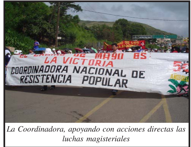
La Coordinadora, apoyando con acciones directas las luchas magisteriales

La huelga de los trabajadores de HONDUTEL que lograron un incremento salarial superior al establecido por el gobierno, al igual que los médicos internistas. Las movilizaciones con paro de labores de los empleados de la Secretaría de Cultura y Turismo, de SETCO, del Instituto Nacional de la Familia. La oleada de luchas y pequeños triunfos llegó incluso hasta el sector privado, donde el SITRATERCO, otrora poderoso sindicato bananero, realizó a fines de julio un paro de labores logrando el reintegro de trabajadores despedidos.