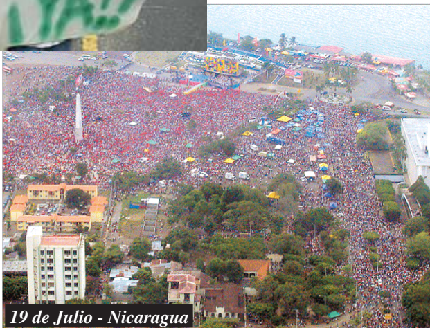
19 de Julio - Nicaragua