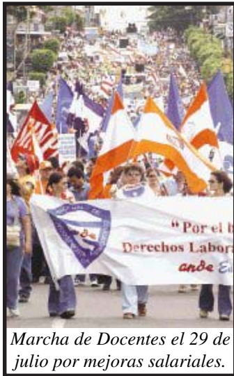
Marcha de Docentes el 29 de julio por mejoras salariales.

en Costa Rica. Supone la transformación de los colegios de secundaria en instituciones “tecnológicas”, implementando “Talleres Tecnológicos”. Tales talleres implicaran el despido de muchos educadores, y el deterioro de la calidad de la enseñanza pública, que se pondrá al servicio del mercado laboral que impondrán con el T.L.C. las transnacionales gringas, formando mano de obra barata para sus maquinillas.