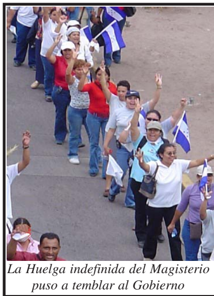
La Huelga indefinida del Magisterio puso a temblar al Gobierno

2. La unidad fue factor clave en esta lucha, sin unidad no hubiéramos hecho nada. Afortunadamente el recambio de dirigencia en el COLPROSUMAH, así como la comprensión de los demás colegios magisteriales de que la firma del acta del 5 de julio del 2002 y la aprobación de la Ley de Reordenamiento del Sistema Retributivo del Gobierno Central, fueron duros golpes para el magisterio, hicieron posible la unidad de los gremios magisteriales. El concepto de unidad que concebimos desde el principio fue el de unidad para luchar , de otra manera esta unidad no hubiera