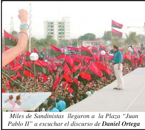
Miles de Sandinistas llegaron a la Plaza "Juan Pablo II" a escuchar el discurso de Daniel Ortega

salir de la aguda crisis económica, para ellos los trabajadores y los jóvenes debemos discutir y rechazar todas esas propuestas que pretenden embellecer al decadente capitalismo nicaragüense. Debe abrirse una profunda discusión democrática en todo el país.