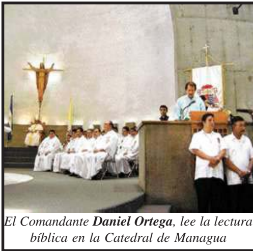
El Comandante Daniel Ortega, lee la lectura bíblica en la Catedral de Managua

El primero ejes, es la recomposición de sus relaciones con la Iglesia. Durante los años 80, la Iglesia Católica fue uno de los principales blancos de los ataques propagandísticos y tácticos por parte del aparato burocrático sandinista. Ahora el FSLN, arrepentido de su pasado ha pedido el perdón