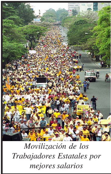
Movilización de los Trabajadores Estatales por mejores salarios

mientras que a las familias del sector rural que consumen esa misma cantidad de agua el porcentaje de ajuste fue del 75%, lo cual significa en términos absolutos 2031 colones. La tarifa de alcantarillado subió un 69% y 82% en el sector urbano y rural. En el mes de julio, las diversas empresas de servicio eléctrico de Heredia (ESPH), Cartago (JASEC) y San Carlos (COOPELESCA) subieron la tarifa de electricidad en un 17.4%, 19% y 20.3%, respectivamente. La Compañía Nacional de Fuerza y Luz