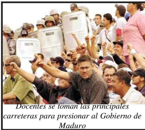
Docentes se toman las principales carreteras para presionar al Gobierno de Maduro

La reciente huelga del magisterio en Honduras, que movilizó a miles de maestros y profesores de las seis organizaciones magisteriales existentes en el país, concluyó con un importante triunfo evitando la pérdida de viejas conquistas económicas como los colaterales (quinquenos, zonaje y grado