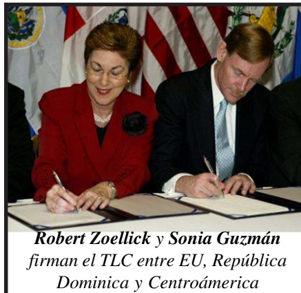
Robert Zoellick y Sonia Guzmán firman el TLC entre EU, República Dominicana y Centroamérica

ser ratificadas en una cumbre de presidentes en Agosto próximo) son: el establecimiento de jornadas de 24 horas de trabajo en las oficinas aduaneras y demás servicios de frontera y el reconocimiento mutuo de registros. Según los ministros burgueses, estas medidas dan "vía libre" al comercio interregional que llega a la elevada suma de 3 mil millones de dólares anuales. Este proceso de integración, tiene como próximo paso la homologación de los productos no provenientes de la región. Este veloz proceso de apertura económica y libre comercio tendrá claros reflejos en la estructura de la burguesía de los países centroamericanos, para el caso, hay