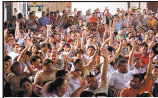
La participación democrática de los docentes en la lucha, se manifestó en las Asambleas.

ya a los estudiantes y padres de familia que mostraron ser formidables aliados en la lucha que libramos, si dejamos pasar esta coyuntura