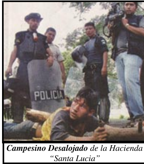
Campesino Desalojado de la Hacienda “Santa Lucia”

Un dato que ilustra lo que exponemos es que, según la 27 encuesta empresarial realizada por la Asociación de Investigación y Estudios Sociales (ASIES), en promedio las empresas guatemaltecas trabajan actualmente al 75% de su capacidad productiva