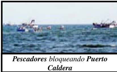
Pescadores bloqueando Puerto Caldera

Los pescadores amenazaron con bloquear con sus propias pangas la entrada de los cruceros en el puerto sino se cumplían sus demandas. Luego