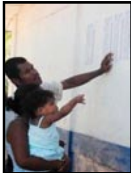
Los Padrones "defectuosos", estuvieron a la orden.

pues el plan fue que desde la estructura del CSE se manejase el voto; esto lo logran controlando el padrón electoral, la distribución de las Juntas Receptoras de Votos (JRV), e incluso el proceso de cedulación. Así el sandinismo controla geográficamente el panorama electoral, y posee la capacidad de alterarlo ya sea mediante el padrón electoral, como de la distribución de ciudadanos por circunscripción y JRV.