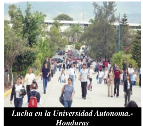
Lucha en la Universidad Autonoma.- Honduras