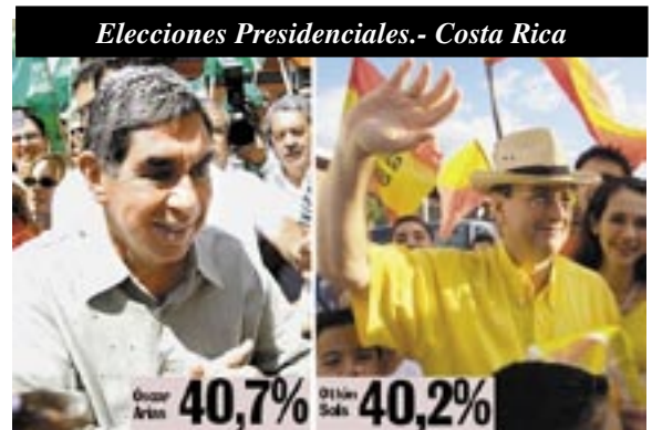
Elecciones Presidenciales.- Costa Rica