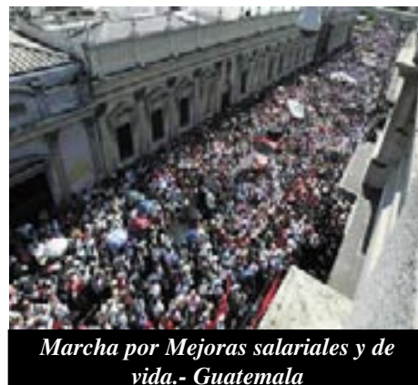
Marcha por Mejoras salariales y de vida.- Guatemala