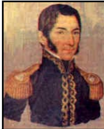
¡¡ Los educadores debemos seguir la lucha de Morazán!!

Luchemos por una educación pública gratuita: por la merienda escolar, por la eliminación de exámenes de admisión, por un servicio educativo reflexivo y transformador, por un servicio de transporte gratuito para los estudiantes, por más becas estudiantiles, por mejores centros educativos, por una cobertura nacional del servicio educativo, por más y mejor profesionalización del personal docente. ■