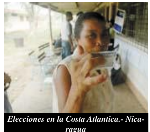
Elecciones en la Costa Atlantica.- Nica- ragua