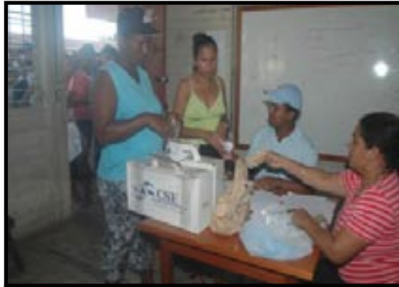
El pueblo Costeño debe exigir una Verdadera Autonomia que garantice trabajo y progreso para todos.

de Presupuesto de la República, lo que deriva en una irresolución total