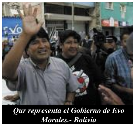
Qui representa el Gobierno de Evo Morales.- Bolivia

Declaracion de la Liga Socialista Internacional sobre el Triunfo de Evo Morales en Bolivia Pág. 12