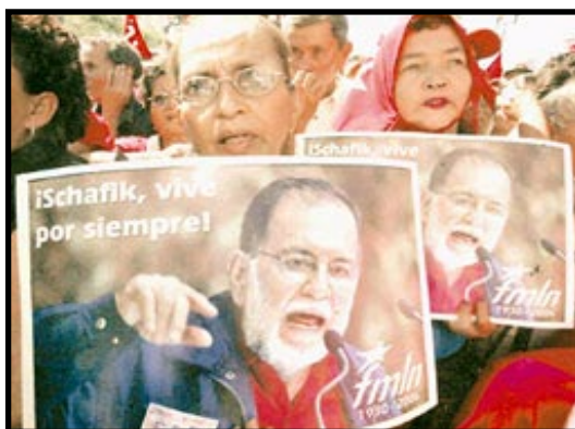
Miles de salvadoreños despidieron a Shafick Handal.

En 1989 se prepara la última insurrección del FMLN completamente influenciado por la acción reformista del PCS y aunque con mayor capacidad de fuego, la insurrección tenía la clara intención de forzar una negociación. En 1992 se firman los acuerdos de Paz en Chapultepec.