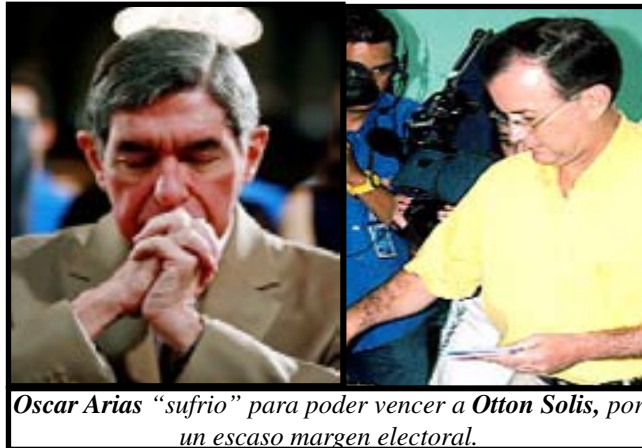
Oscar Arias “sufrió” para poder vencer a Ottón Solís, por un escaso margen electoral.

y la crisis de Liberación Nacional, que sacando a “competir a su mejor hombre” no logra una victoria masiva como esperaba; mientras que el PAC, beneficiado por un pacto sin principios en el voto a presidente, demuestra que su tamaño es mucho menor que esa votación. Es importante señalar que el abstencionismo es de 887,365 individuos, o sea, el 34.79% del padrón (2,550,613); más que cualquiera de los dos candidatos mayoritarios, lo que