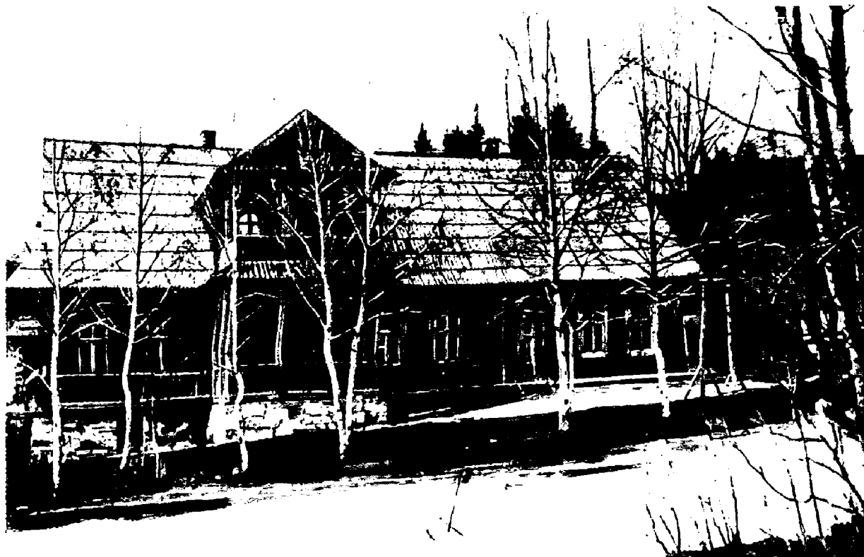
La casa en Poronin en la que vivió V. I. Lenin en el verano de 1913 y 1914