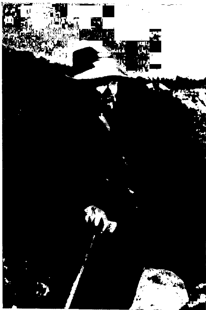
V. I. LENIN EN ZAKOPANE